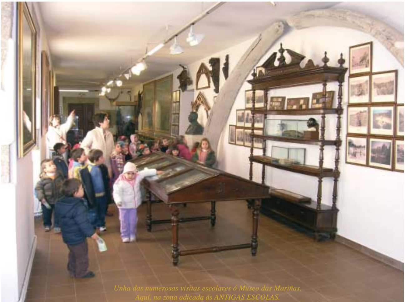
Unha das numerosas visitas escolares ó Museo das Mariñas. Aquí, na zona adicada ás ANTIGAS ESCOLAS.