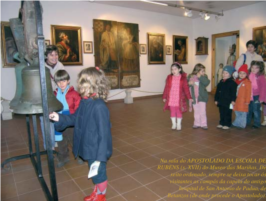
Na sala do APOSTOLADO DA ESCOLA DE RUBENS (s. XVII) do Museo das Mariñas. De xeito ordenado, sempre se deixa tocar ós visitantes as campás da capela do antigo hospital de San Antonio de Padua, de Betanzos (de onde procede o Apostolado).

estaba a capela de San Roque, hoxe reconvertida en oficina principal de Caixa Galicia, pero que aínda se pode ler dalgún xeito. Pegada a ela está un edificio pequeno, moi singular: o antigo Colexio de Orfas,