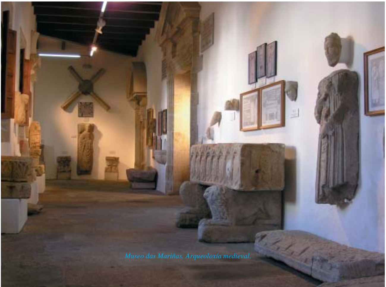
Museo das Mariñas. Arqueoloxía medieval.

Aínda hai máis elementos que complementan as pezas orixinais deste museo, tales como maquetas e fotografías. Unha maqueta monumental está na entrada para explicar o territorio da antiga provincia