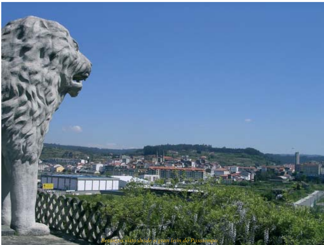
Betanzos visto desde o gran león do Pasatempo.

Os dous irmáns fundaron conxuntamente: o Lavadeiro Público das Cascas (1901) e o Patronato Benéfico-Docente «García Hermanos» (1908), que constaba dun Asilo (1912) e das Escolas «García Hermanos».