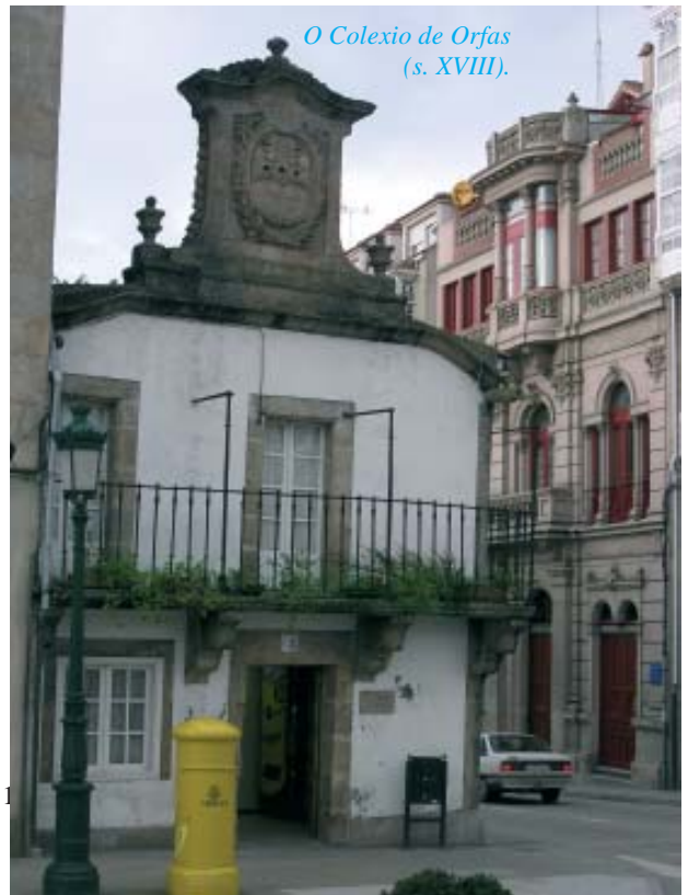
O Colexio de Orfas (s. XVIII).

Betanzos defínese como unha típica cidade medieval amurallada, con campo de feira extramuros. Así pois, pasado o Campo,