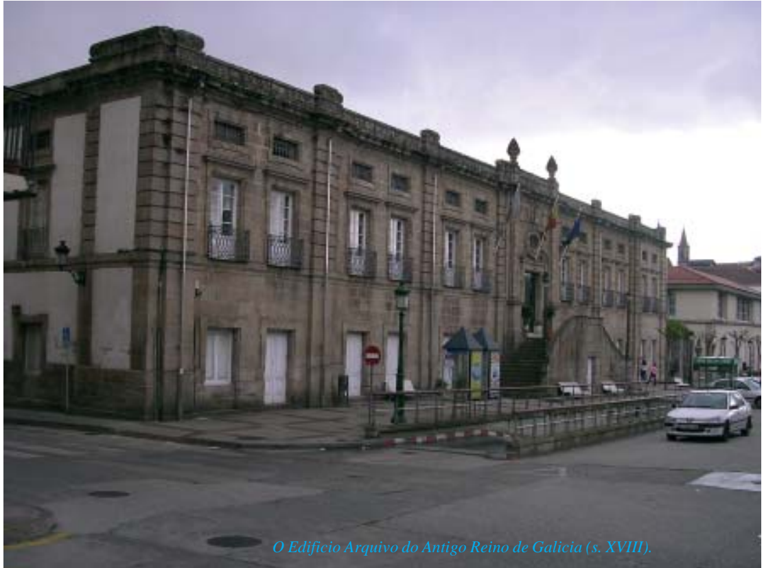
O Edificio Arquivo do Antigo Reino de Galicia (s. XVIII).