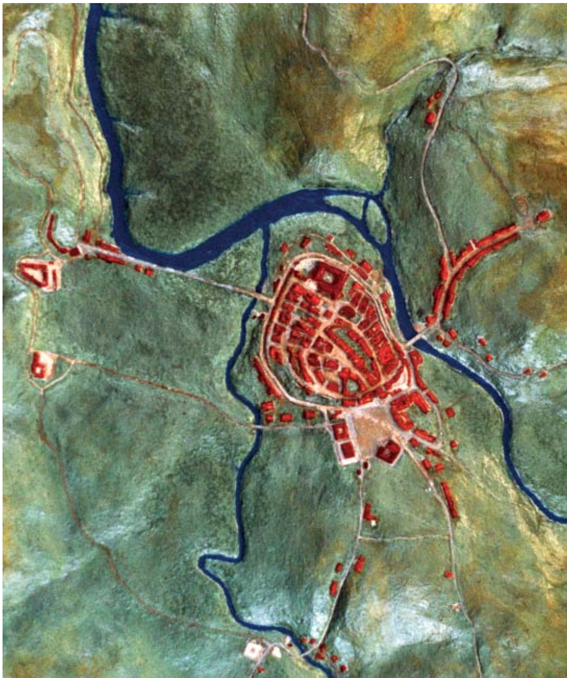
Maqueta de Betanzos (realizada por don Juan de la Fuente para o Museo das Mariñas), baseada no plano da Enciclopedia de Madoz de mediados do s. XIX.

Logo, este museo é moi interesante no aspecto simbólico, tanto cara a Betanzos como no que se refire a Galicia e mesmo a España. Se xa falamos dalgunhas bandeiras, engádase a das Irmandades da Fala de Betanzos, única que se conserva dese movemento en Galicia, que eu saiba. Un tambor dos bandos de 1844 é tamén unha