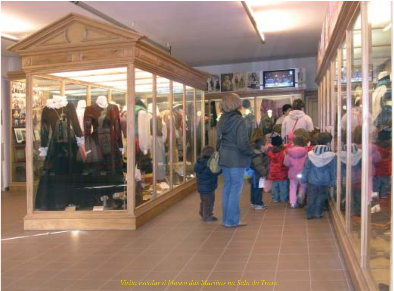
Visita escolar ó Museo das Mariñas na Sala do Traxe