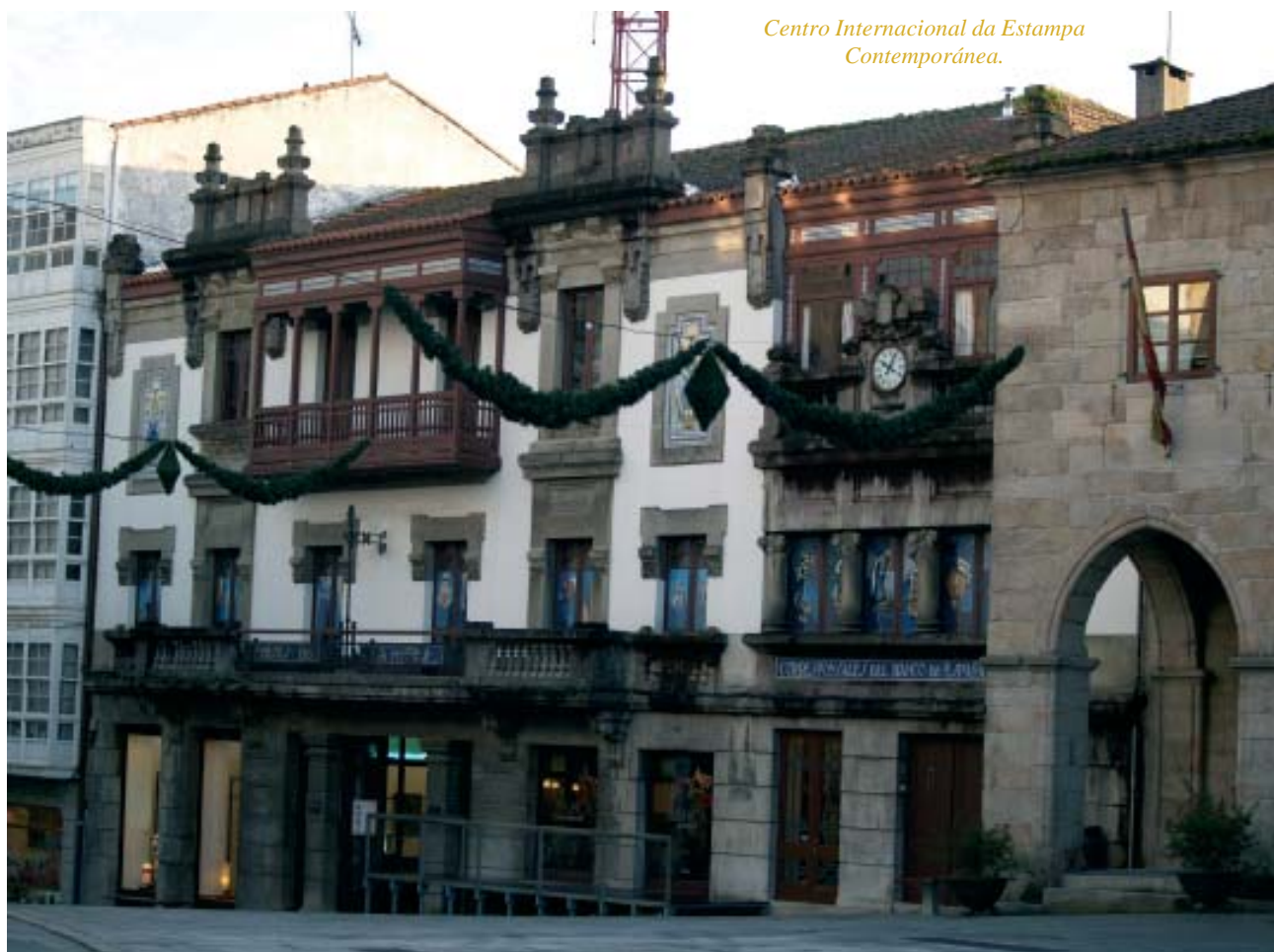
Centro Internacional da Estampa Contemporánea.