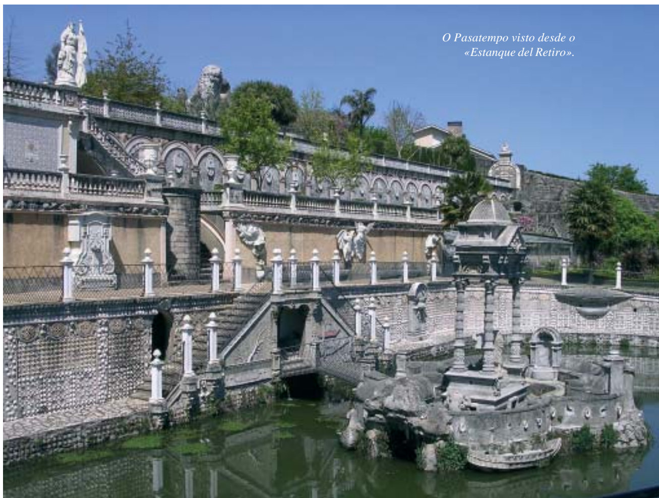
O Pasatempo visto desde o «Estanque del Retiro».