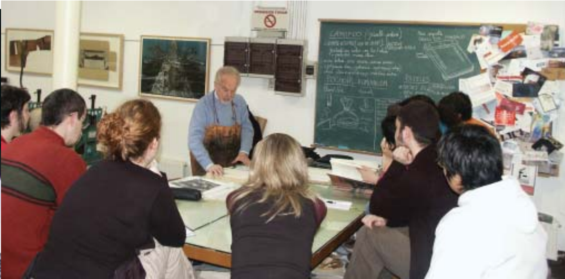
Talleres do Centro Internacional da Estampa Contemporánea.