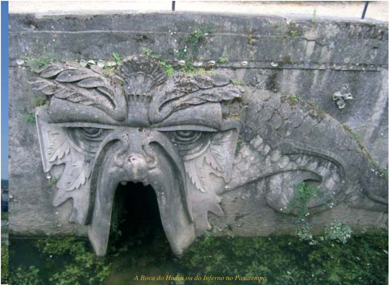
A Boca do Hades ou do Inferno no Pasatempo.

O tempo empleado foi, polo tanto, necesariamente dilatado, con épocas de baixa actividade, como entre 1908 e 1912 cando construía o Asilo e as Escolas e, así mesmo, entre 1914 e 1918 por problemas de subministro de materiais, debido á Primeira Guerra Mundial. Con todo, no 1914 estaba practicamente configurado, aínda que continuou mercando novos terreos e engadindo ideas.