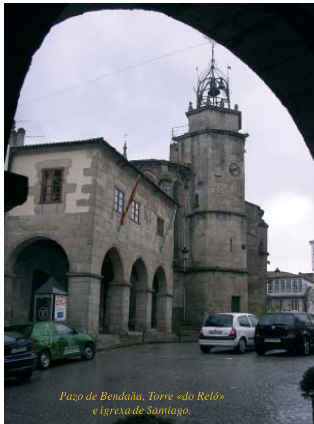
Pazo de Bendaña, Torre «do Reló» e igrexa de Santiago.

Se damos a volta cara a croa do castro, pasaremos pola cima da empinada Rúa dos Ferreiros, que remata cunha fermosa porta da muralla coa primeira inscrición en letra humanística da cidade, que a data no 1500. E na cima hai outra chea de monumentos arredor da praza da Constitución: a igrexa gótica (antes románica) de Santiago, con varios sepulcros antropomorfos e o retablo do arcediano Pedro de Ben, realizado por Cornelius de Holanda; a torre municipal, o pazo e torre de Lanzós, o pazo gótico de Bendaña, o edificio do concello (finais do s. XVIII e principios do XIX) de fachada neoclásica, debida a Ventura Rodríguez, a Casa Núñez, hoxe convertida en Centro Internacional de Estampa Contemporánea (C.I.E.C.).