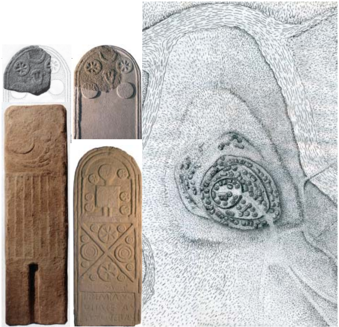
Estelas funerarias romanas no Museo das Mariñas. Dous baleirados (abaixo, de Espenuca e de Mazarelas) e anaco dun orixinal (Recebés).