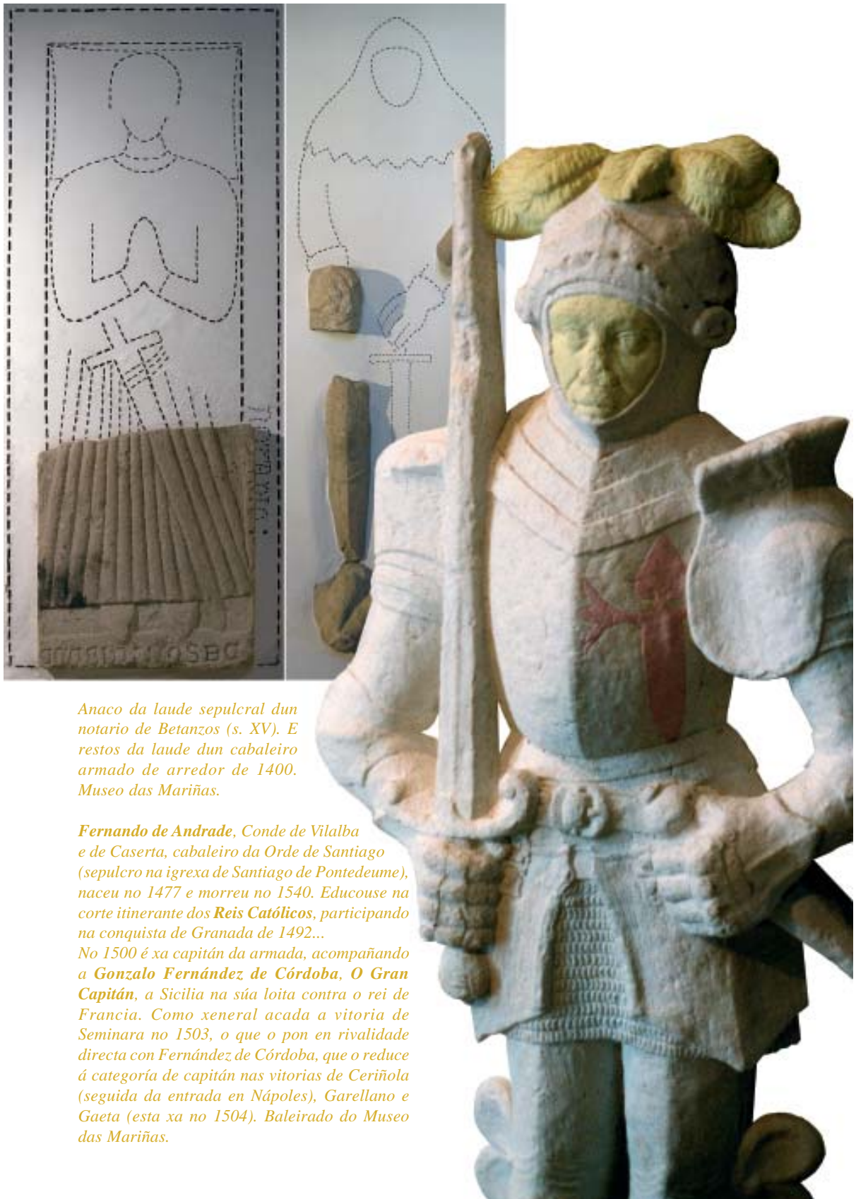
Anaco da laude sepulcral dun notario de Betanzos (s. XV). E restos da laude dun cabaleiro armado de arredor de 1400. Museo das Mariñas.

Fernando de Andrade , Conde de Vilalba e de Caserta, cabaleiro da Orde de Santiago (sepulcro na igrexa de Santiago de Pontedeume), naceu no 1477 e morreu no 1540. Educouse na corte itinerante dos Reis Católicos , participando na conquista de Granada de 1492... No 1500 é xa capitán da armada, acompañando a Gonzalo Fernández de Córdoba, O Gran Capitán , a Sicilia na súa loita contra o rei de Francia. Como xeneral acadou a vitoria de Seminara no 1503, o que o pon en rivalidade directa con Fernández de Córdoba, que o reduce á categoría de capitán nas vitorias de Ceriñola (seguida da entrada en Nápoles), Garellano e Gaeta (esta xa no 1504). Baleirado do Museo das Mariñas.