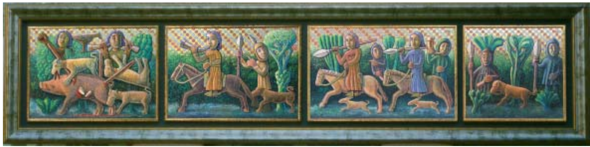
Nesta páx. e na seguinte (lectura de dereita a esquerda) desenrólanse as escenas de montería da ábsida da igrexa de S. Francisco de Betanzos. Deseño e cor hipotética de Alfredo Erias. Museo das Mariñas.

Este é, por conseguinte, un museo de espectro temático amplo no que se intenta contar, mediante imaxes e co mínimo texto posible, unha historia esencial do noso pasado, das nosas raíces; unha historia que chegue antes ó corazón que á cabeza. O asombro é o primeiro paso para edificar un recordo sólido, pero o asombro precisa ás veces de elementos que van máis aló das pezas orixinais: precisa dunha certa concepción teatral, partindo do espazo co que se conta e da circulación por el dos visitantes. Iso intentouse aquí. Por exemplo,