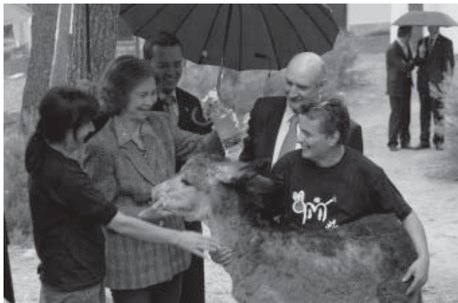
Foto visita SM la Reina Dña Sofía “Bautizo de burro con anís de Rute”

5ª) Preparación del anís especial elaborado con motivo de la visita a Rute de SM la Reina Dña. Sofía (24-9-08) con dedicatoria especial de Su Majestad a Destilerías Duende con motivo del centenario.