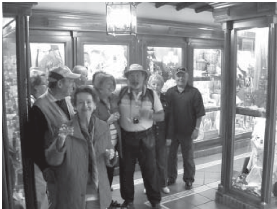
Instantánea de grupo canadiense en la sala 3ª o "de la mujer"

El perfil de grupos es variado, continuando en descenso el nº de gru-