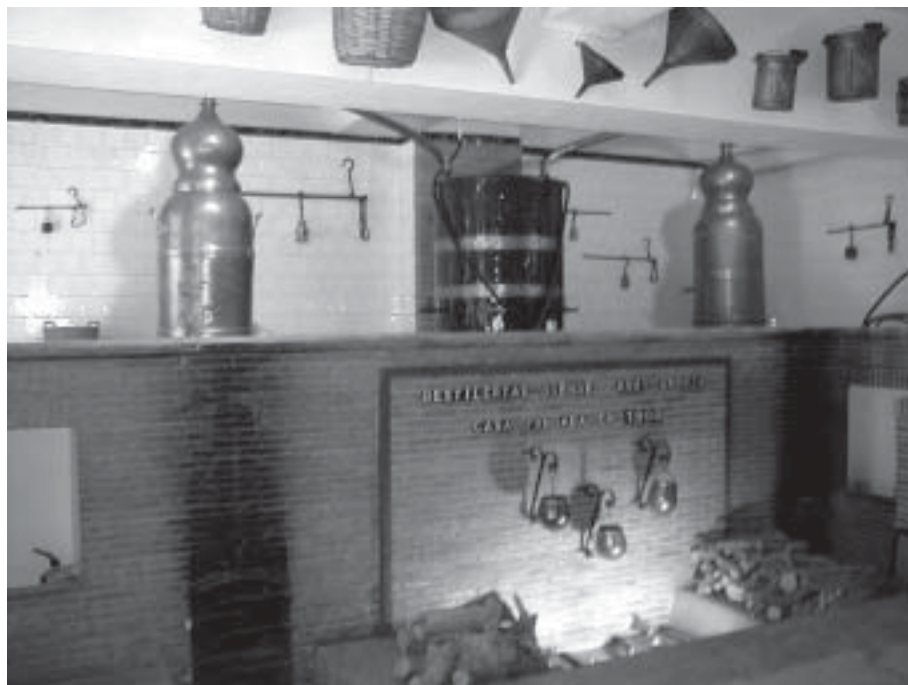
Vista general de la sala de alambiques originaria de la destilería. Principios del siglo XX

La Sala tercera o de la Mujer está destinada a la exposición de botellas,