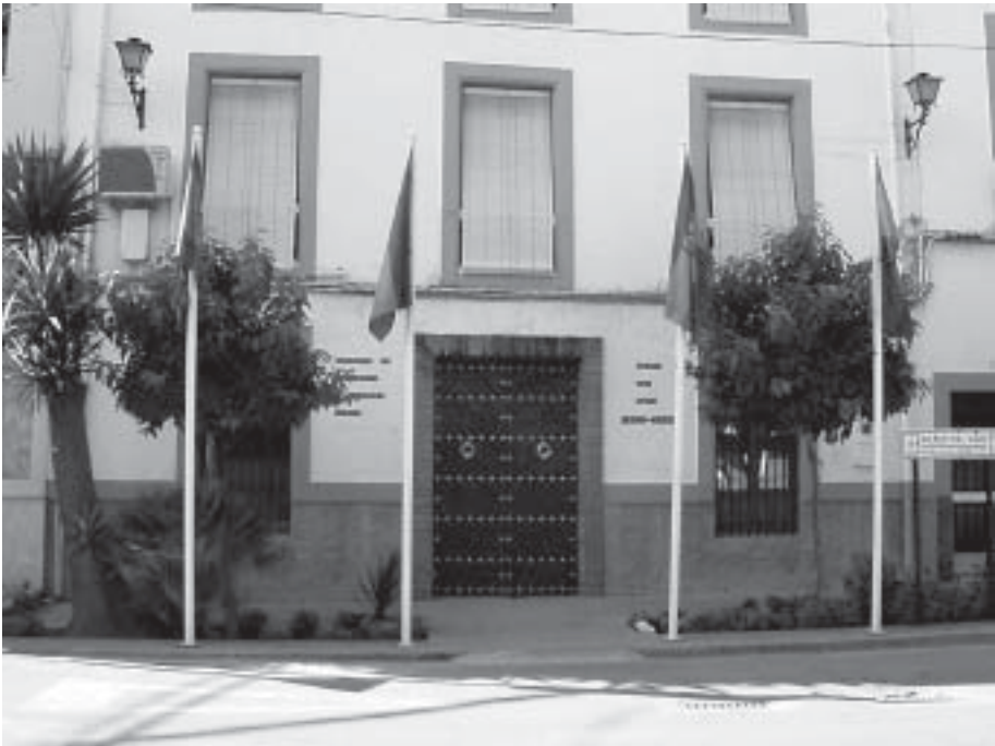
Fachada principal del museo del anís de Rute sito en Rute (Córdoba) C/ Paseo del Fresno nº 2

Duende SL; una antigua empresa ruteña cuya creación data del año de 1908, dependencias que fueron restauradas para la ocasión, sufragando los gastos Destilerías Duende SL con la aportación del programa Leader a través de Iniciativas Subbéticas. En este año 2008 se ha celebrado el cen-