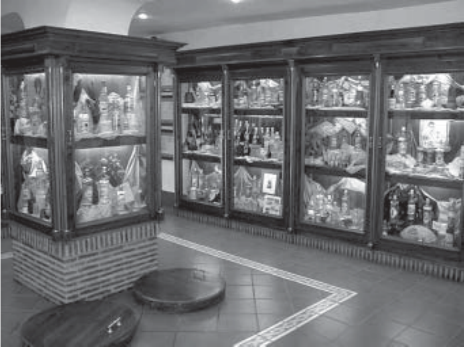
Vista general de la Sala 2ª o de maceraciones. Contenido expositivo: botellas, publicidad, maquinaria y documentación clasificada por marcas de anís de Rute (siglos XIX y XX)

documentos y otros objetos relacionados con el anís y licores de Rute que se han inspirado en la mujer para sus denominaciones.