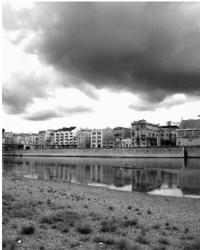
El riu Ebre quan passa per Tortosa

passat i dels que es forgen un futur a base de superar-ne els greuges que se'n derivaren. Tots plegats entre terres i entre guerres sobre de múltiples punts de vista sobre la guerra civil.