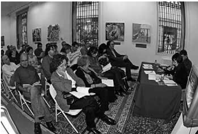
Un de les sessions a l'Alliance Française