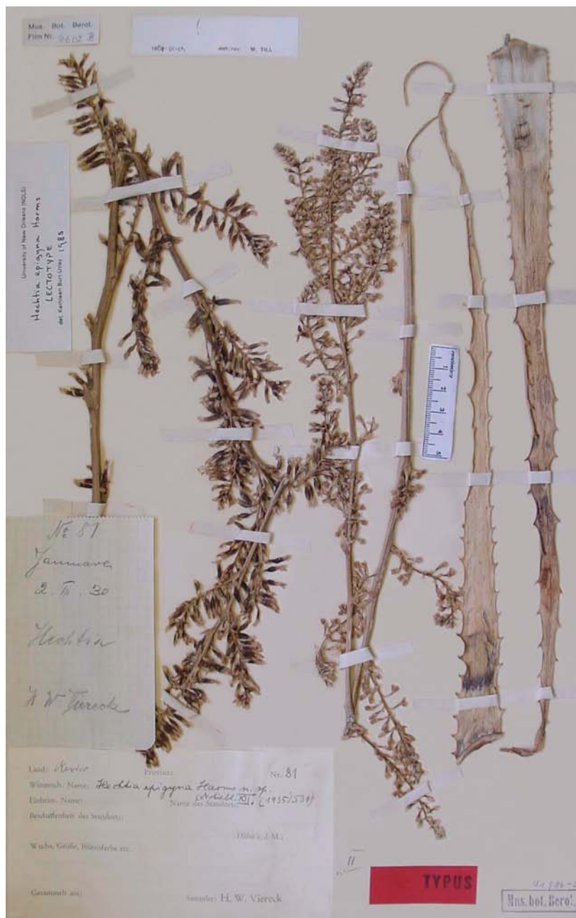
Fig. 1. Holotipo de Hechtia epigyna .