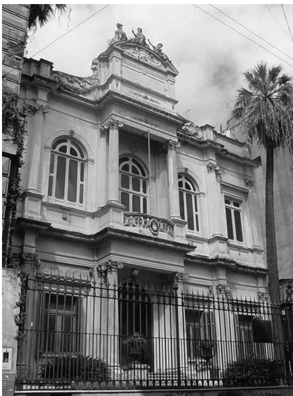
Figura 2. Fachada del Museo Etnográfico J. B. Ambrosetti sobre la calle Moreno.

La búsqueda de presupuesto para llevar a cabo las actividades de la Sociedad fue un tema que desveló desde el inicio a las distintas comisiones directivas. Ya en el acta de reunión del 23 de septiembre de 1936 leemos que el Presidente inició una gestión oficial ante la Comisión Nacional de Cultura 7 para obtener un subsidio de $2.000 que sería destinado a las publicaciones programadas por la entidad. Este subsidio, más lo recibido por el pago de las cuotas sociales, garantizó el funcionamiento de la SAA durante el transcurso de la década 8 .