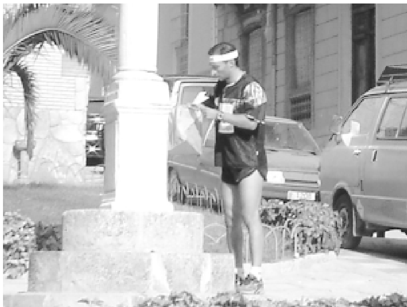
Baliza en circuito urbano.