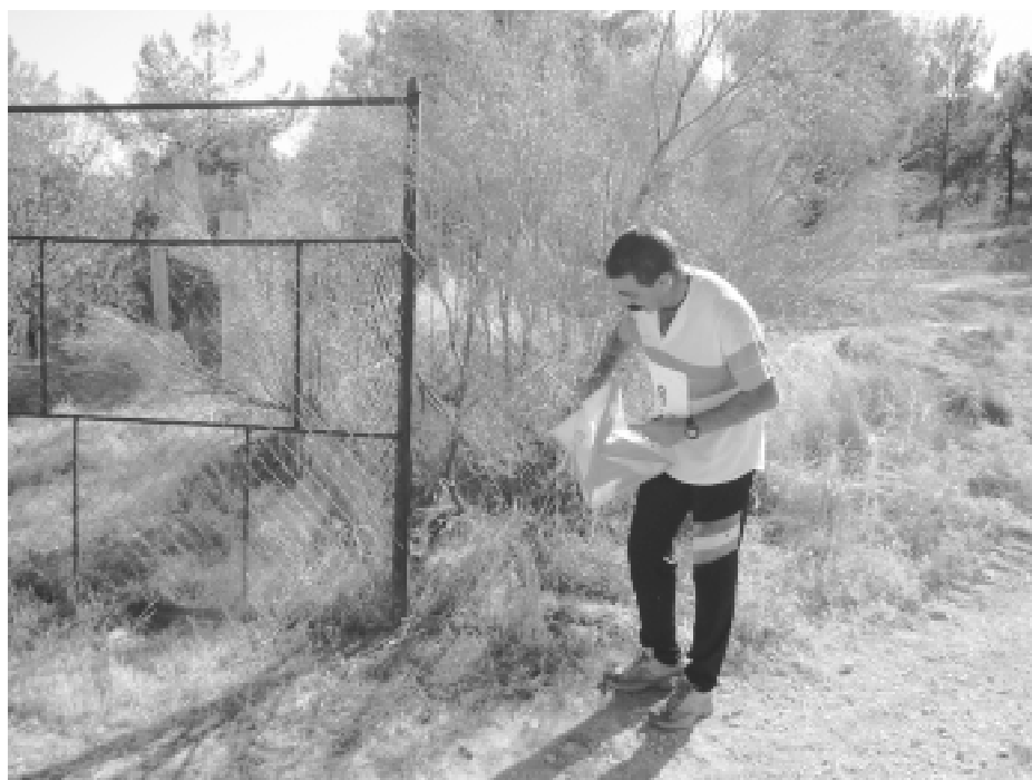
Baliza en campo (arriba). Momento de la carrera en campo (abajo)