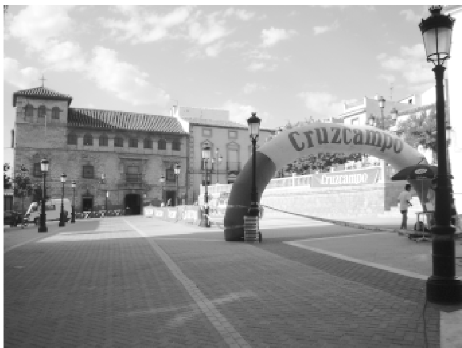
Meta de la carrera urbana. Plaza de la Constitución. Cabra del Santo Cristo.