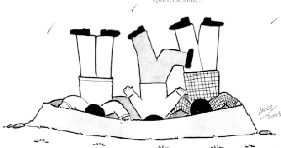
ILUSTRACIÓN DE MIGUEL JUAN CARLOS NARANJA HUERTAS