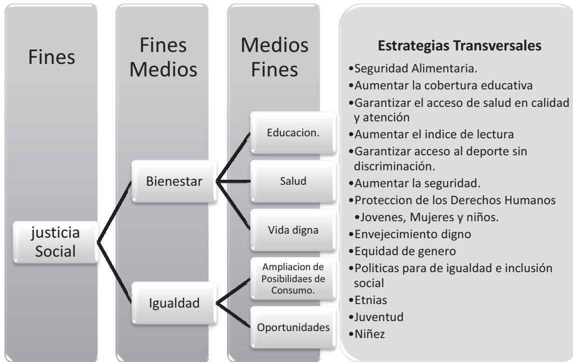
Figura 3: La Planificación En Medellín: Coincidencias con la teoría de la Planificación.

Fuente: Construcción propia a partir del PNUD y Alcaldía de Medellín (2007).