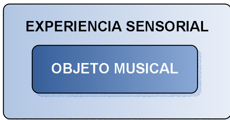
Fig.1 RESPUESTA MOTRIZ.

Etapa donde el objeto musical es percibido globalmente determinando una experiencia de marcado carácter sensorial. Ver Fig.1