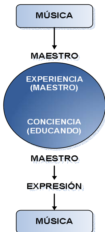
Fig.2 LA SÍNTESIS