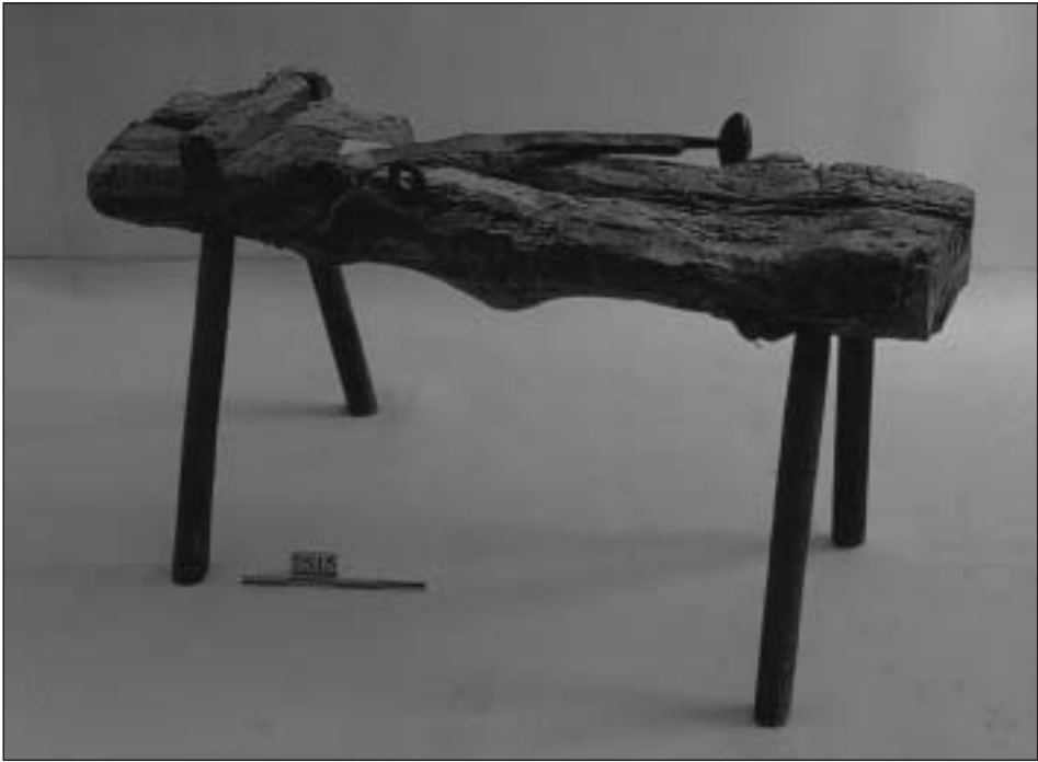
Banco de cucharero procedente del taller de José Presto, en Linzoáin (Valle de Erro). Museo Etnológico de Navarra