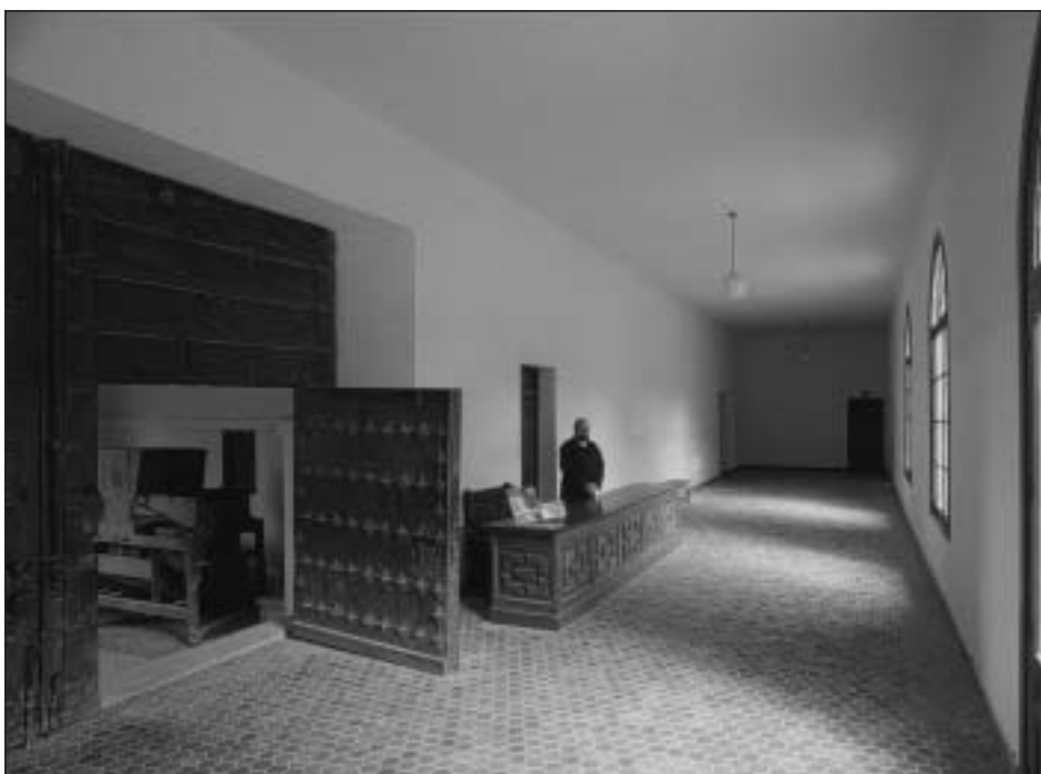
Aspecto actual de los espacios destinados al Museo Etnológico dentro del “claustro nuevo” de Irache