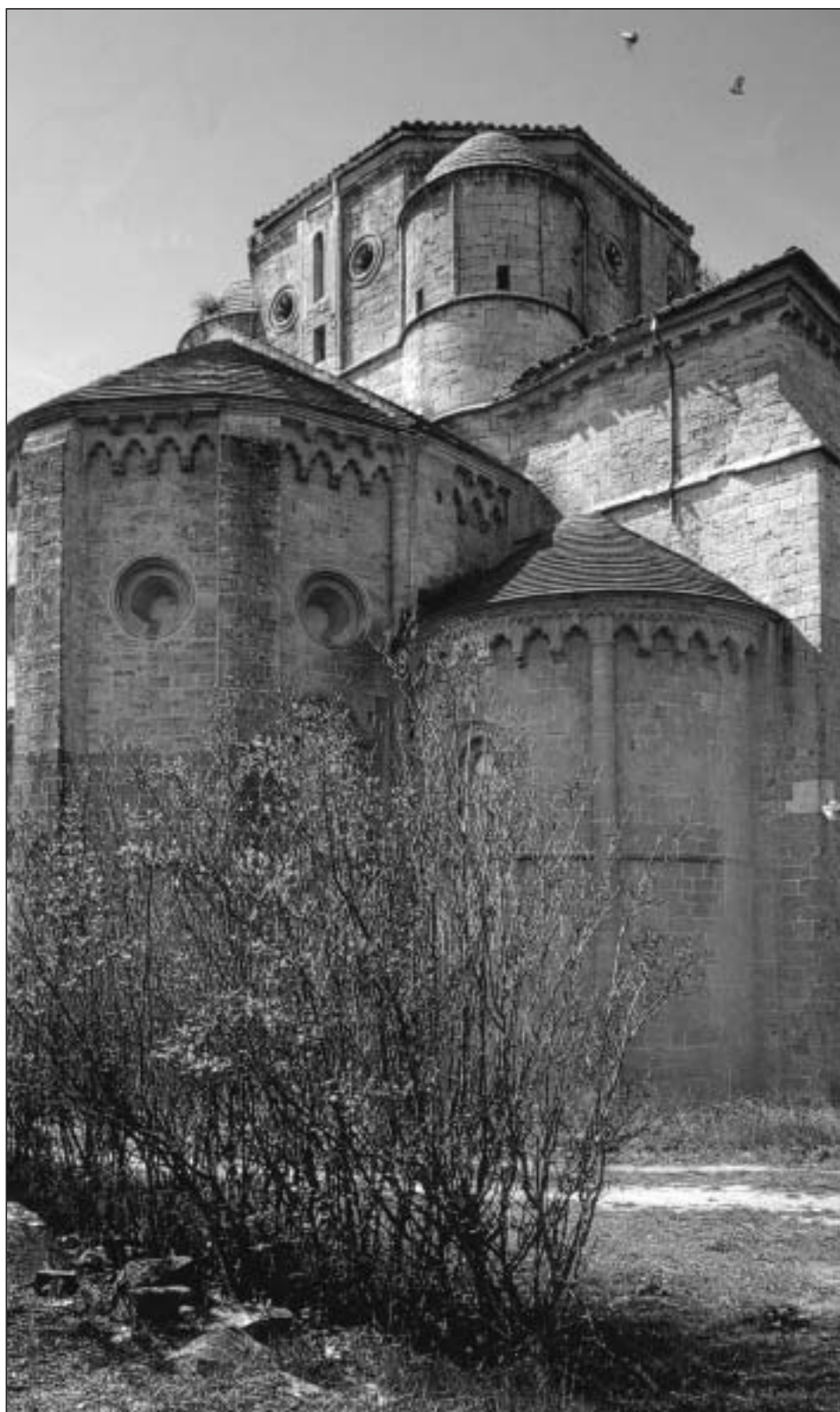
Vista exterior de los ábsides románicos del monasterio de Irache, sede del Museo Etnológico de Navarra