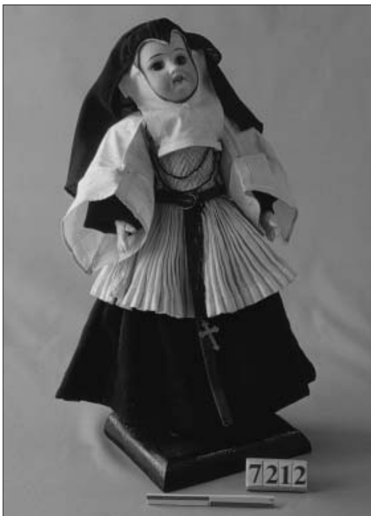
Muñeca vestida con hábito carmelita de 1896, procedente de la casa Sanz de Galdeano, en Oco (Valle de Ega). Museo Etnográfico de Navarra.