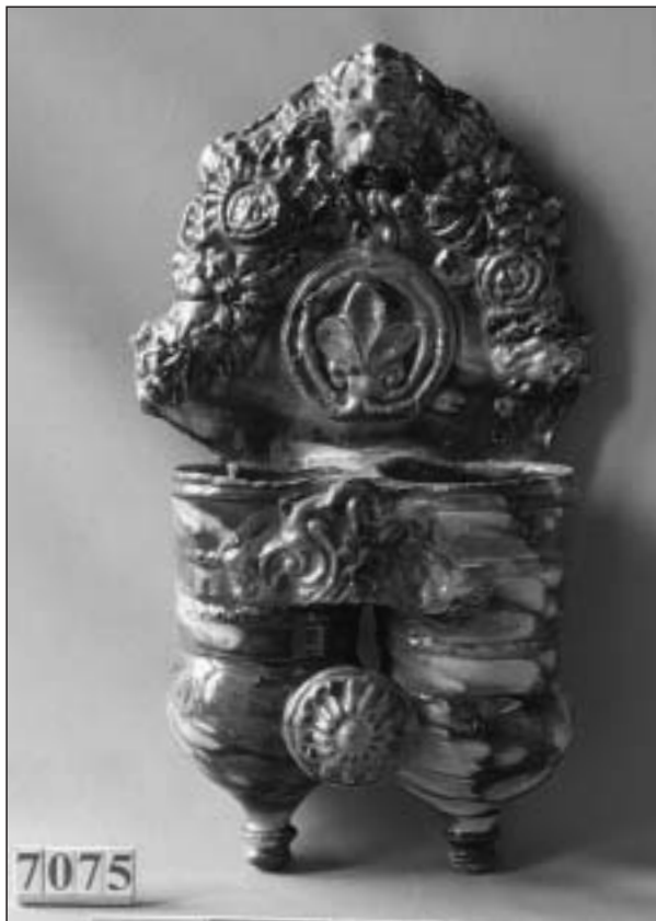
Cucharero de Estella. Museo Etnográfico de Navarra