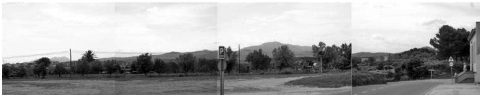
Vista panoràmica des de l'entrada principal del cementiri de Sant Nicolau, d'esquerra a dreta: Montserrat, Serra de l'Obac, Sant Llorenç - La Mola i el Puig de la Creu.

que solament trobem de manera plena en cinc cementiris més i parcialment en catorze.