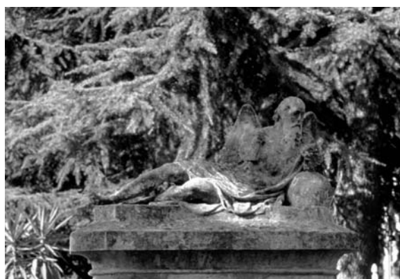
Escultura dedicada al vell alat Metatron, tema molt singular a l'estatuària funerària (actualment, es troba a la sala d'autòpsies). Tomba monumental de Gabriel Bracons i Roca (1874). Mestre d'obres: Josep Lacueva i Sanfeliu.

Per tant, estic segura que les característiques formals del cementiri de Sant Nicolau, diferentment de la resta de cementiris catalans, desfigurats al llarg de la història a causa de les diverses ampliacions que han sofert i de les pressions perifèriques que han hagut de suportar, el fan un indret, com a conjunt i com a model, únic i d'una alta comprensió didàctica respecte el fenomen vuitcentista de l'urbanisme higienista. Així doncs, és a la ciutadania i a les institucions pertinents a qui els correspon determinar fins a quin punt els interessa salvaguardar aquest ric patrimoni artístic i urbanístic.