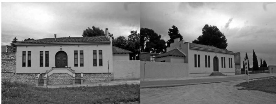
Casa de l'encarregat del cementiri i sala de dipòsit, construccions realitzades entre el 1918 i el 1919 per l'arquitecte Josep Renom i Costa i restaurades l'any 1973, per l'arquitecte Félix de Azúa.

Catalunya que li atribuís la categoria de Bé Cultural d'Interès Nacional. Des d'aleshores he continuat treballant en aquesta línia i, després dels estudis realitzats estic en disposició de provar que, la suma i la coincidència de totes les característiques morfològiques concurrents en el cementiri de Sant Nicolau, li atorguen un caràcter únic que, tractat de manera adequada, pot esdevenir un centre d'interès patrimonial i de divulgació cultural de primer ordre.