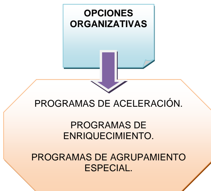
Esquema nº 1. Diferentes opciones organizativas para alumnos/as con altas capacidades intelectuales.

Podemos agrupar los programas para los estudiantes muy capacitados en tres modelos (Alonso y Benito, 2004):