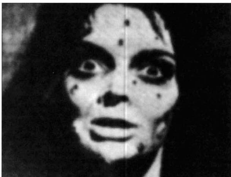
Ilustración 4 y 5. Fotograma de la película «Interview with the Vampire» de Neil Jordan (1994). La «vampirización» mantiene hermoso al vampiro, en contraposición a la vampiro Asa (Barbara Steele), protagonista del film de Mario Bava «La Maschera del Demonio») (1960).