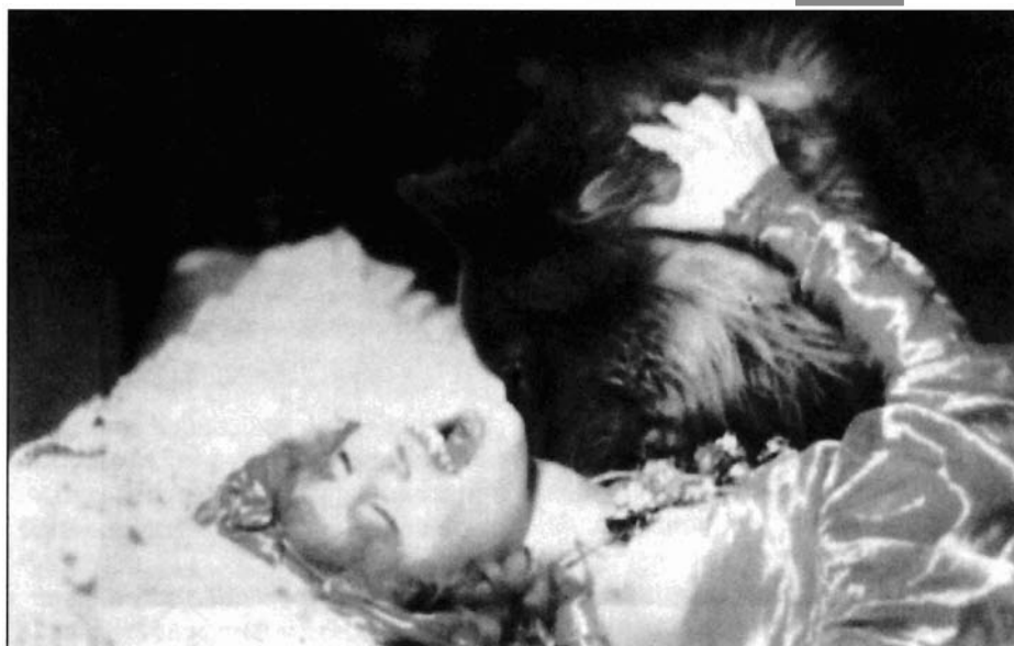
Ilustración 2 y 3. Francis Ford Coppola nos dio una imagen directa de la relación del vampiro con la zoofilia. Algunos de estos fotogramas del film «Drácula de Bram Stoker» (1993), fueron eliminados por la censura estadounidense.