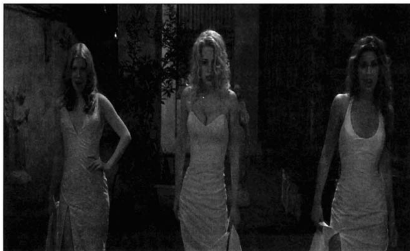
Ilustración 7. Fotograma del film de Patrick Lussier «Drácula 2000» (2001), que en España se estreno bajo el título de «Drácula 2001». La figura de la mujer vampiro ha sido tratada por el género como sumisa a su creador y dominante con sus víctimas.