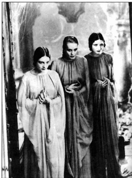
Ilustración 6. Fotograma de la película «Drácula» de Tod Browning (1931).