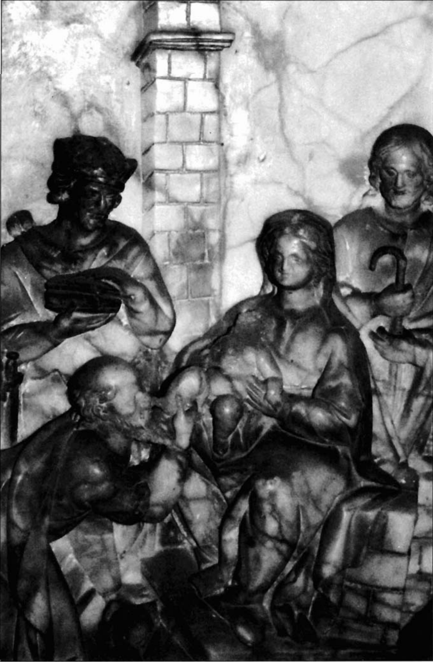
Ilustración 4. Relieve de la Adoración de los Reyes (detalle).