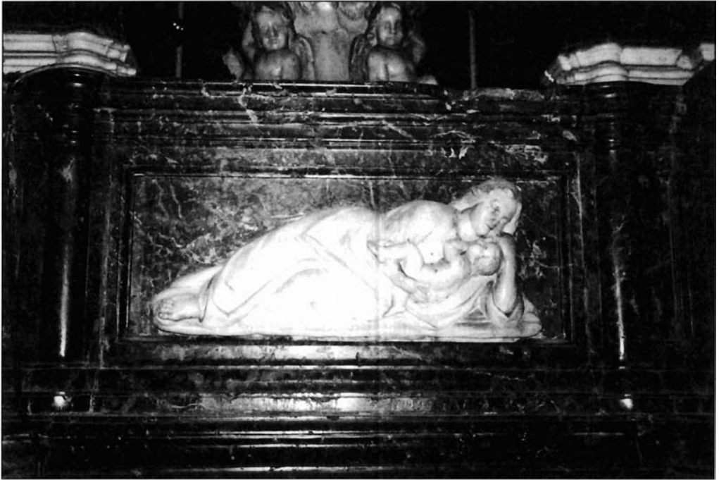
Ilustración 5. Relieve de la Caridad.

en el contrato han de ser de piedra de Escúzar, relieves labrados en alabastro procedente de dicha cantera granadina. En ellos se representan, y por este orden, el misterio de la Encarnación, cuyo tema ocupa el medallón de mayor tamaño situado en el eje de la frontalería anterior, acompañado por otros dos relieves con las efigies de san Mateo y san Marcos; en el frontal del lado de la Epístola, la escena representada es la de la Natividad y junto a ella aparece en sendos medallones las imágenes de san Gregorio Magno y san Jerónimo; en la parte posterior del mueble se figura la Adoración de los Reyes y los evangelistas san Lucas y san Juan y, por último, en el frontal del lado del Evangelio, se sitúa la representación del misterio de la Resurrección de Cristo acompañada por san Agustín y san Ambrosio de Milán.