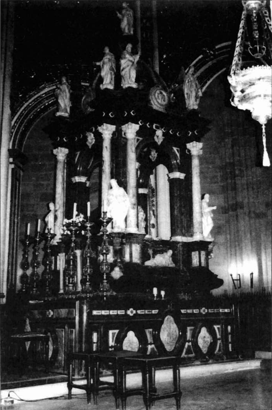
Ilustración 2. Tabernáculo de la Catedral de Almería.