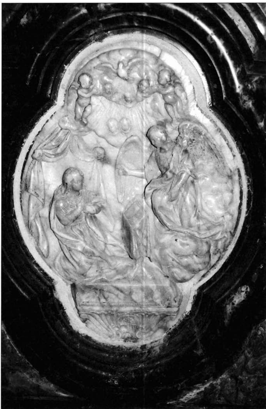
Ilustración 3. Relieve de la Anunciación.