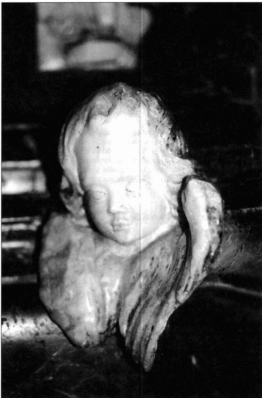
Ilustración 8. Cabeza de ángel.