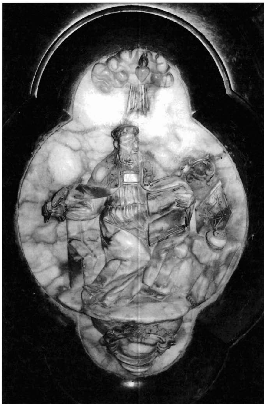
Ilustración 6 Padre de la Iglesia. Relieve.