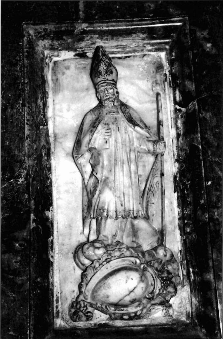
Ilustración 7. Santo Obispo. Relieve.