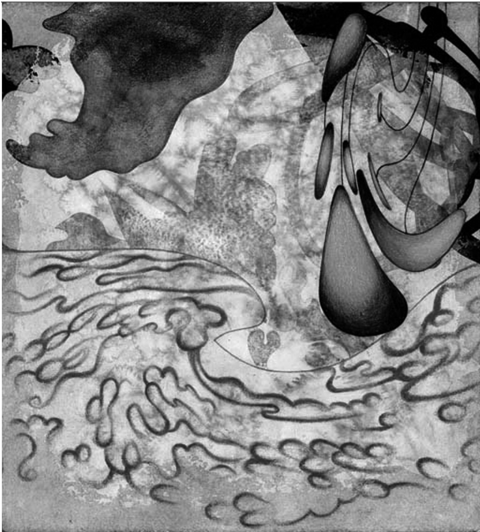
Detalle de Amor-fosis I-11