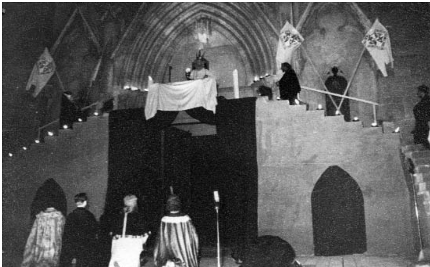
El gran teatro del mundo, a la façana de Sant Fèlix –24 maig 1952.