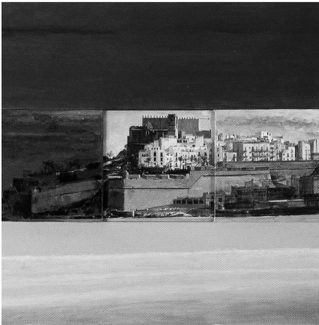
Peníscola. 60x60 cm

Els resultats han estat visibles a les col·leccions Abecedari dels estils de la pintura moderna i a Els quatre estils . Coneixent aquest treball anterior no ens deixa de sorprendre amb l'actual Variacions . Una col·lecció en la que torna a treballar en diferents estils. Així ens presenta obres que es troben dins des de la més pura figuració a l'abstracció o al minimalisme.