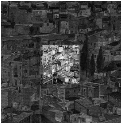
Tortosa. 50x50 cm

L'artista Joaquim Busquets ens està acostumant a presentar-nos unes creacions que es troben fora de tota obra "habitual". Amb aquesta paraula em refereixo als quadres que veiem penjats a museus o galeries d'art (sense que signifiqui cap crítica negativa).