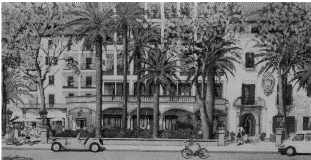
Passeig del port de Pollensa, Mallorca. 96x77cm

Amb l'entusiasme de la realització d'una exposició totalment altruista va crear vint-i-set aquarel·les d'un estil hiperealista en el que el més mínim dels detalls és tingut en compte. Tant paisatges com bodegons van demostrar que es tractava d'una tasca elaborada amb tècnica precisa, cura dels elements compositius, delicadesa en les tonalitats emprades i una predilecció per tot allò que indiqui un treball conscient, disciplinat i concret.