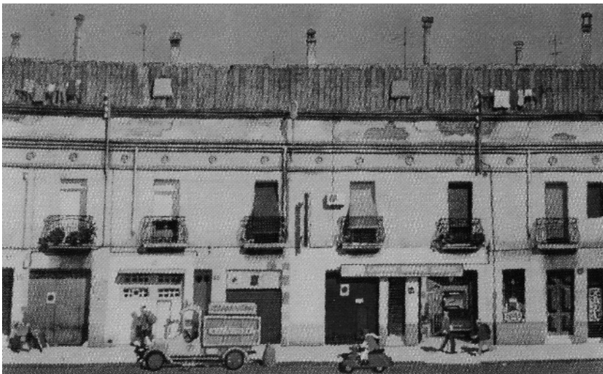
Carrer Sant Vicenç, segle XXI. 96x50cm