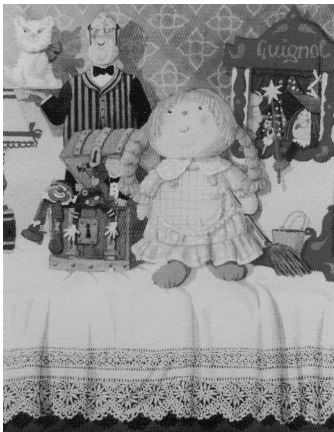
Nina i ninots. 70x58cm