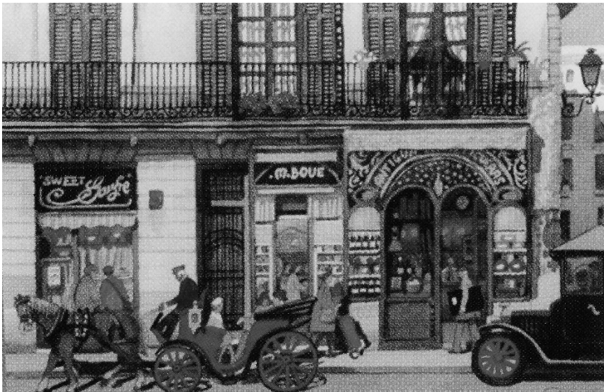
Ramblas, Barcelona. 59x49cm