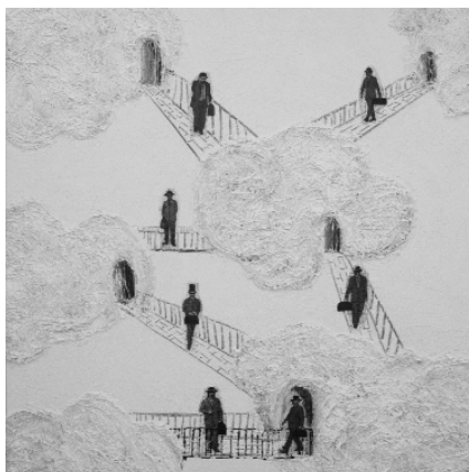
Especulació. 100 x 100 cm. Tècnica mixta i collage, sobre tela.