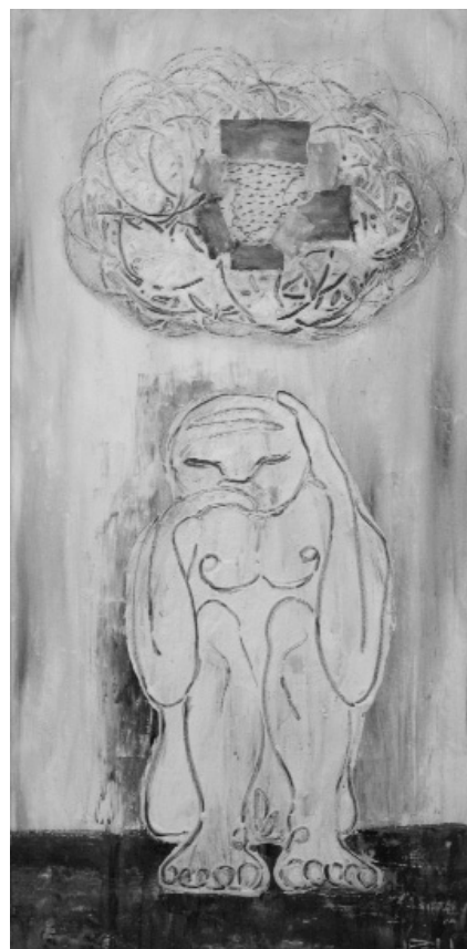
Dia gris. 120 x 60 cm. Tècnica mixta i collage, sobre tela.