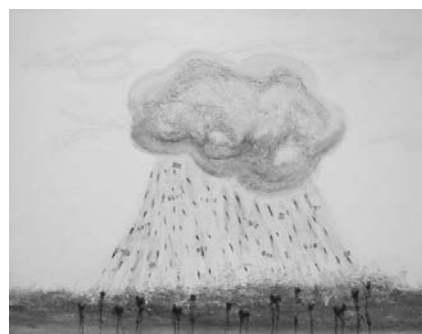
Anònim. 140 x 180 cm. Tècnica mixta i collage, sobre tela.

Aquí deixem constància de totes les imatges que constitueixen la sèrie Slovún perquè siguin elles les que parlin per si soles. ●