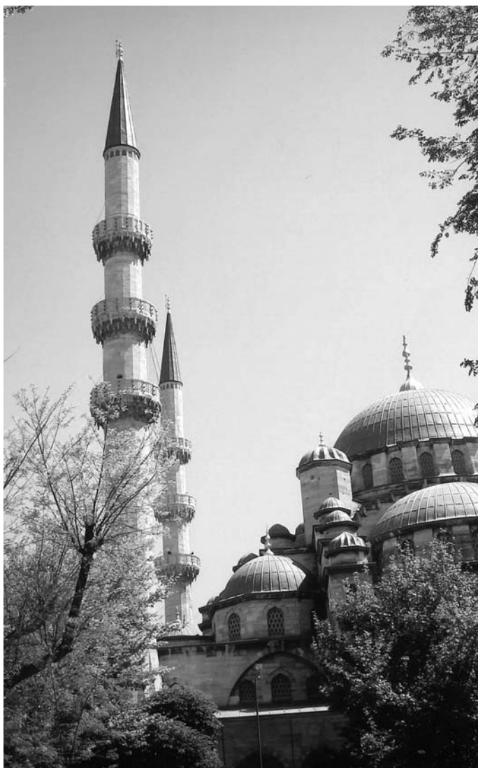
Yeni Camii, Eminonu.

Pont entre Europa i Àsia, envaït i alliberat mil vegades, dóna la impressió que, en ser un terreny de pas cap al Mediterrani, els pobles que hi passaven creien que s'hi podien quedar i fer fora els que hi havia establerts en aquell moment. Així, Turquia ha estat bressol de grans i diverses civilitzacions que li han llegat una immensa riquesa cultural i històrica.