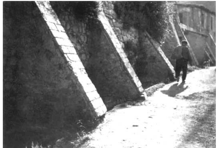
El Rec antic d'Igualada.