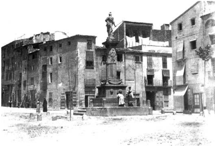
Plaça del Rei d'Igualada anys 30.