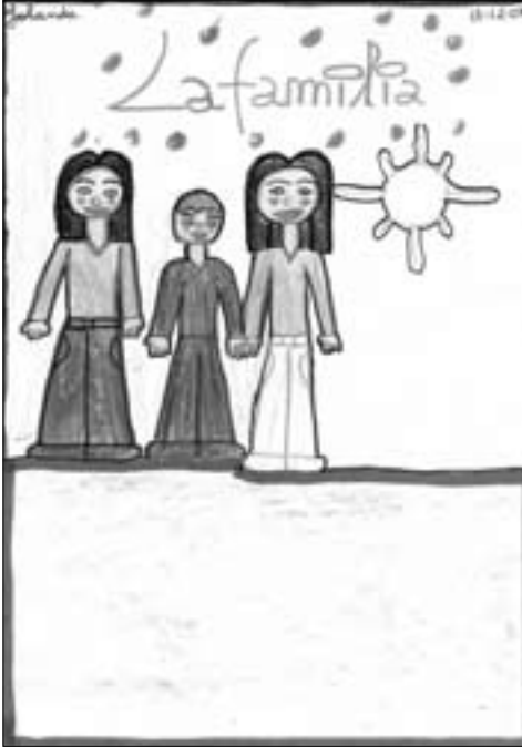
Dibuixos de famílies exemple de monoparentalitat.

Dels dibuixos de què disposem, 2 constitueixen famílies monoparentals estrictament sense que intervinguin altres persones; dels 2 dibuixos 1 resulta especialment revelador de com concep el nen la situació de divorci, ja que situa el seu pare separat del grup residencial, i 1 fa referència a una llar amb nucli