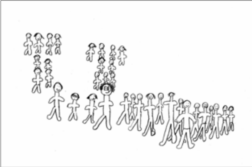
Dibuix exemple de memòria familiar.

a família: cosins, pares, germans, tiets, avis, besavis... i tota la família morta que ha format part de la meua família.” El nostre concepte de família actualment dista bastant d’aquesta narració, probablement a causa dels estereotips que giren entorn a la família nuclear.