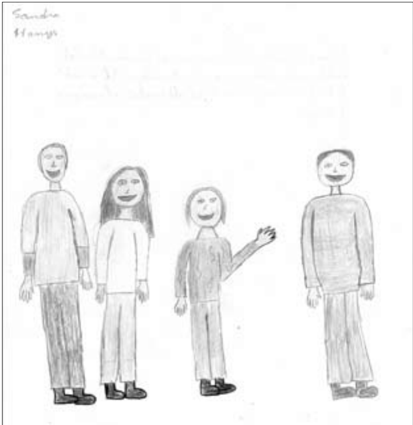
Dibuix exemple de família mosaic.

Irenne Théry va definir dues lògiques de reorganització familiar després del divorci: la lògica de la substitució, que es donaria quan el pare biològic no manté cap relació amb el seu fill i el “pare” social absorbeix els rols que hauria d'acomplir el primer. Es trenca, doncs, l'aliança i la filiació, en aquests casos; i la lògica de perennitat, que es donaria quan es trenca l'aliança però el pare biològic continua mantenint el seu rol paternal amb el seu fill, de manera que la filiació persisteix. Entre aquestes dues lògiques existeixen multitud de variables possibles: per exemple, un pare que s'ha divorciat dues vegades i té fills de les dues primeres exdones