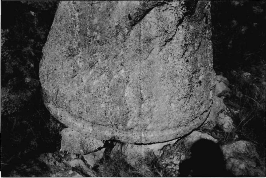
Foto 9. Rulo de almazara I. Detalle de los calzos colocados para poderlo trabajar en su parte inferior.