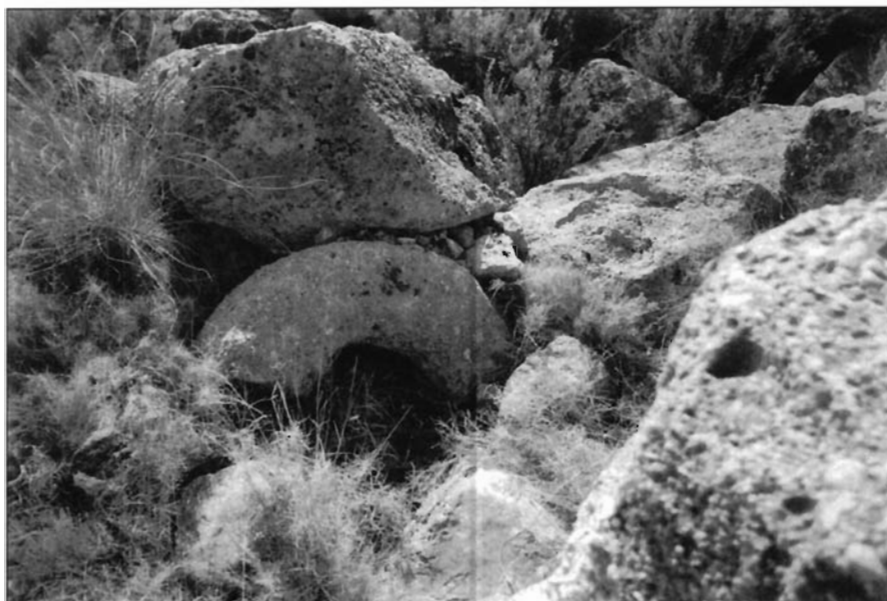
FOTO 7. Piedra labrada junto al rulo de almazara.