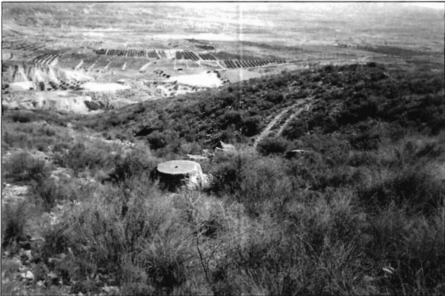
Foto 10. Rulo de almazara II. Sólo está trabajada la parte inferior y se ha comenzado a descuartar el bloque para crear una forma cónica.