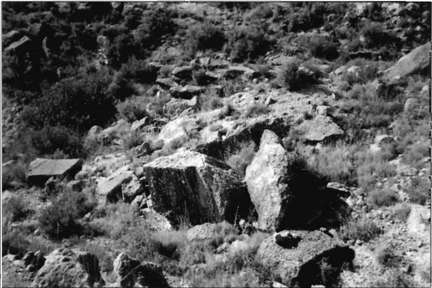
FOTO 5. Bloques desgajados con barrenas en las proximidades del antiguo camino de Caprés.