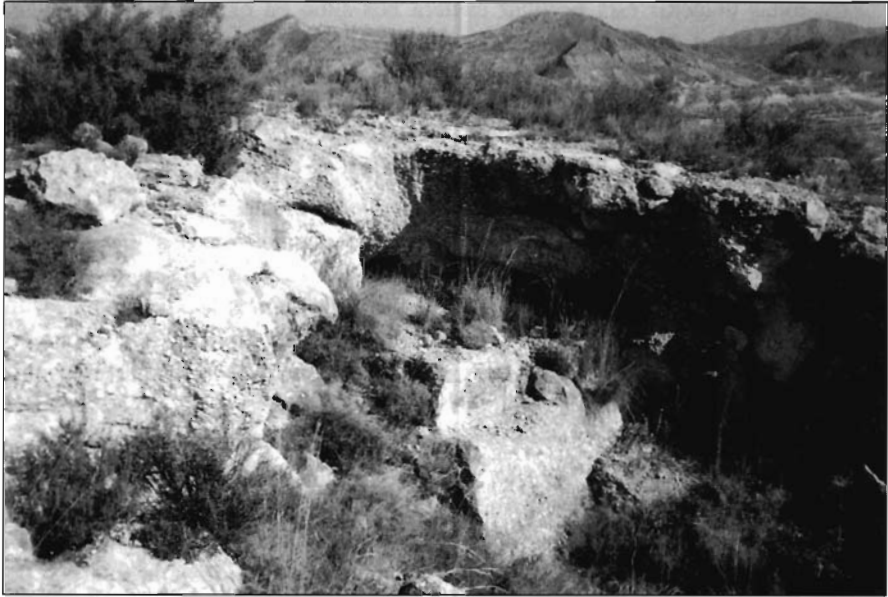
FOTO 4. Cantera de conglomerados en las proximidades del antiguo camino de Caprés.