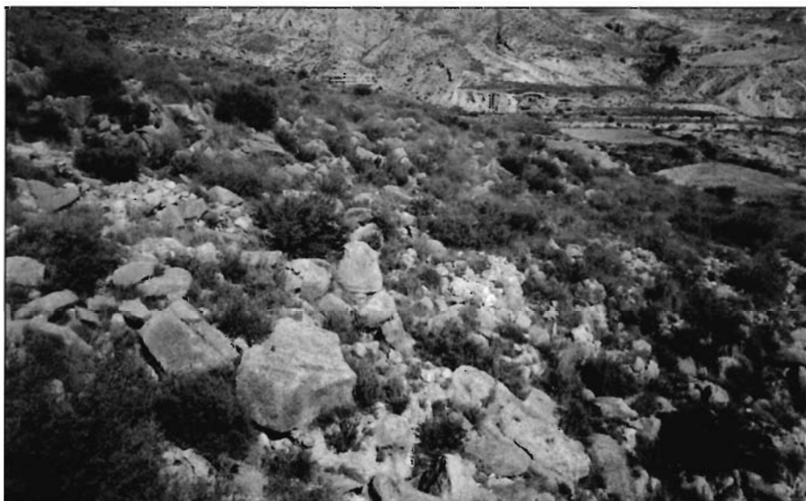
FOTO 6. Rulo de almazara a medio labrar.

Además de la extracción humana de la piedra pudimos comprobar como grandes bloques que se habían desprendido de forma natural de la montaña habían sido trabajados a distintas alturas y en diferentes grados. Así hemos podido localizar hasta el momento tres grandes rulos de almazara que convierten al lugar en el que se encuentran en un verdadero taller (Fotos 6 a 11).