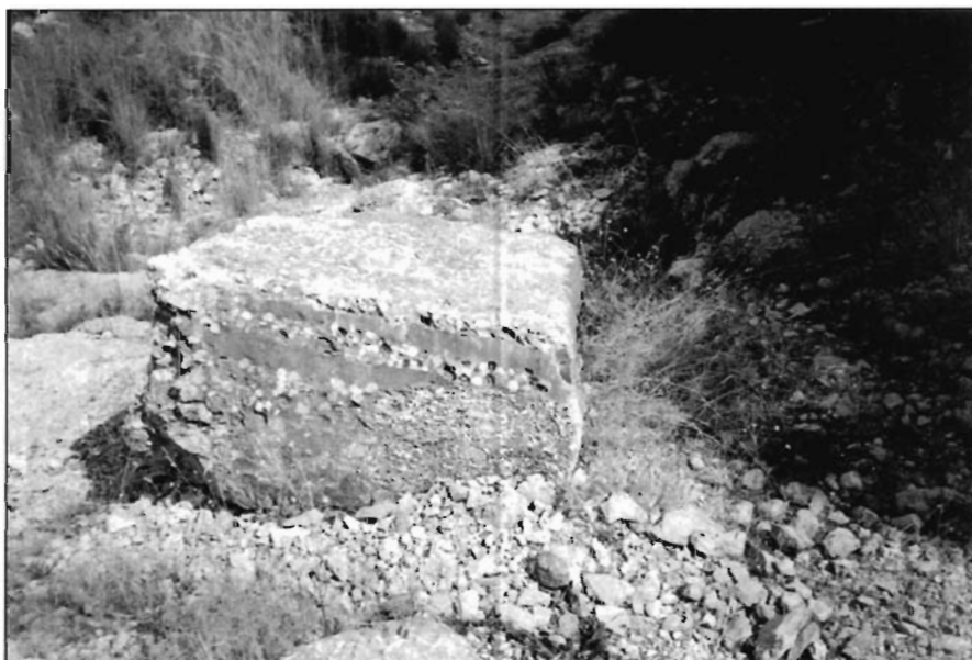
FOTO 2. En la misma cantera el único bloque desgajado que se quedó sin trabajar.