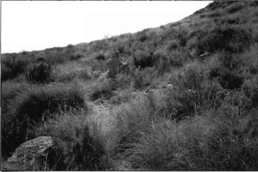
Foto 11. Rulo de almazara III. Inmediato al rulo II. La formación cilíndrica está casi conseguida.

a fuerza de mazo y cincel la forma circular a la base, siempre con golpes oblicuos para facilitar el estrechamiento progresivo del bloque hasta el vértice. Cuando la pared tiene ya una forma cilíndrica se comienza a generar una forma cónica oblonga que permita colocar la piedra sobre su base de manera fácil pero protegiendo la que sería la pared definitiva de cualquier rotura que se pudiera producir durante su manipulación. Una vez volteada la piedra se continuaría trabajando con talla oblicua para conseguir una forma cónica próxima a la definitiva y por supuesto para aliviar el máximo peso posible con vistas al transporte. Tras esto, y por medio de caballerías, cuñas y palancas se transportaría el rulo hasta la cercanía de una zona a la que pudiera acceder un carro. En ese lugar se calzaría, se le practicaría la acanaladura en su base y se dejaría solo a falta del pulido final y la talla del vértice del cono. Tras el transporte a la almazara se realizaría la parte última del proceso y quedaría lista para ser engastada en el molino.