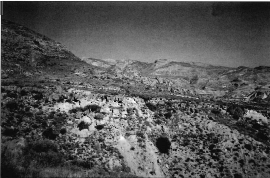
Foto 3. Ladera norte de la Sierra del Baño. Sobre la vaguada se ve el antiguo camino de Caprés.

Estas canteras «bien situadas» superan la veintena (en algunos casos es difícil distinguir donde termina una y comienza otra) y son todas de caliza, utilizándose el material extraído para la construcción de edificios, de canales o de aceras. Pero en esa zona, en un afloramiento de conglomerados y basalto existe otra que aunque de características formales semejantes no tiene correspondencia en los materiales de construcción, al menos de los excavados en el complejo termal (siglos I-II, XII-XIII y XVI-XVIII). Sin embargo sus materiales si son apropiados para molinos de harina y de aceite (FOTOS 1 y 2). Evidentemente no quedan restos de molinos ya que todo lo trabajado tuvo que transportarse en su momento a su destino final.