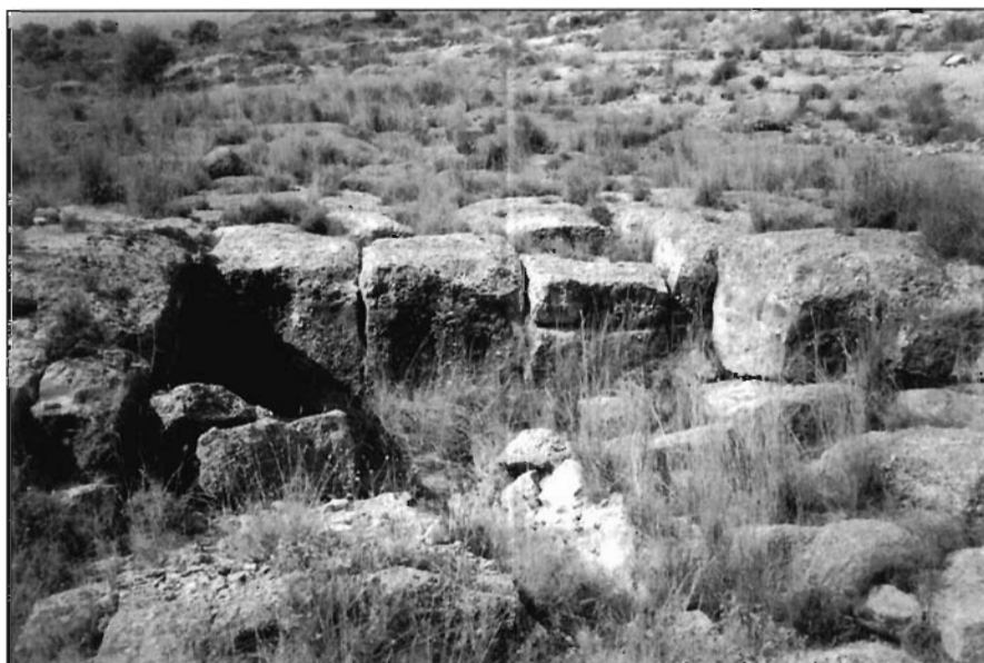
FOTO 1. Cantera de conglomerados en las inmediaciones del balneario romano.