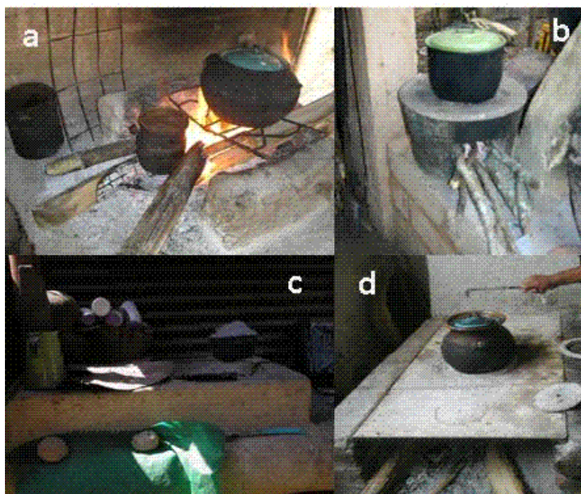
Figura 3. Tipos de fogones utilizados en Ocuilapa de Juárez, Chiapas, México: a) tradicional, b) tipo tina, c) tipo Lorena, d) diseño traído de Centroamérica (Fotografías: Consuelo Escobar y Cristina Yépez).

A pesar de que ya hay un conocimiento sobre las estufas ahorradoras e interés por obtenerlas, así como algunos usuarios de éstas, no se ha logrado la apropiación de estas tecnologías, debido a que no ha habido asesorías respecto a las dudas sobre el manejo posterior a la construcción de las estufas o porque sus actividades no se adecuan al modelo de estufa utilizado, ya que generalmente no tienen oportunidad de escoger modelos dentro de los programas que subsidian estas estufas, lo que ocasiona que los que les proporcionan no siempre sean totalmente aceptados. Es por ello que las nuevas estufas regularmente se combinan con el uso del fogón tradicional.