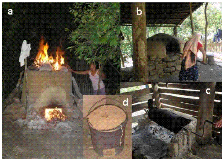
Figura 4. Dispositivos de combustión utilizados por el sector industrial en Ocuilapa de Juárez, Chiapas, México: a) horno de alfarería, b) horno de panadería, c) tostador de café, d) fogón de aserrín que se renueva por cada cocci3n.

formando un orificio que funciona como cámara de combustión que tiene una duración de hasta 3 o 4 horas. Este fogón se rellena de aserrín cada vez que se va a usar y también suele utilizarse para consumo doméstico, generalmente en las unidades familiares que se dedican a la carpintería o viven cerca de estos establecimientos.