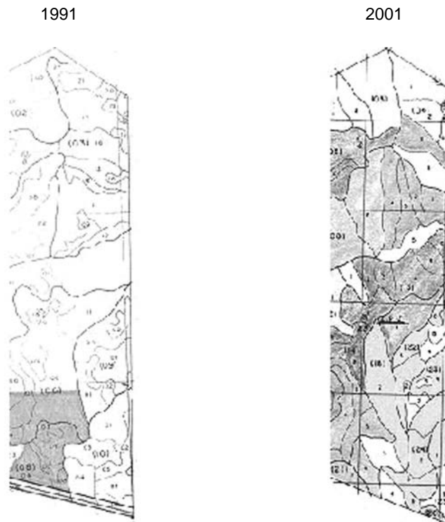
Figura 3. Ejemplo de una sección de un predio mostrando el cambio en la delimitación de los rodales y subrodales en dos ciclos de corta consecutivos

Los resultados de la comparación del volumen en pie indican que existen diferencias tanto negativas (i. e. sobrestimaciones) como positivas (i. e. subestimaciones) en la estimación de este