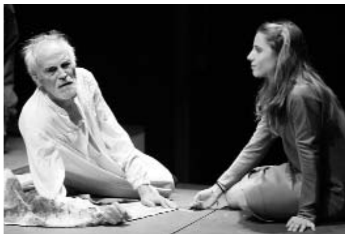
El monarca desterra erròniament la filla petita.

Un vestuari molt eclèctic i atemporal acaba de donar l'últim retoc aquest ambient tràgic i negre que traspua de El Rei Lear . Una gran posada en escena que estarà encara uns mesos en la cartellera del Teatre de Sol.