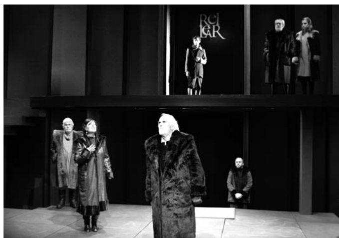
El muntatge està a l'alçada de qualsevol obra professional.