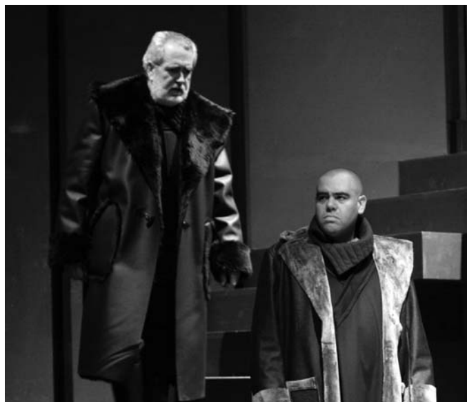
Edmund intentarà amb males arts aconseguir el poder del comte Gloster.