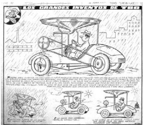
Original de Francesc Tur Mahem, Tur , publicat al n.º 178 de TBO, 1958.

Ana Fernández Álvarez campanadas@telefonica.net