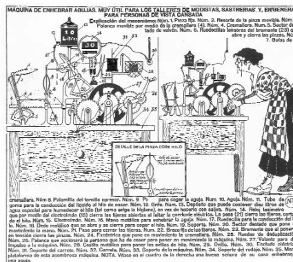
Original de Joan Macias, Nit , publicat al n.º 555 de TBO, 1928.

del disseny, per exemple, de Joan Macias 'Nit', una impossible màquina pensada per a enfilar agulles, a què li diem progrés científic o desenvolupament tecnològic, perquè, tal i com deia Percy Bysshe Shelley: No desperteu mai la serp adormida / no sigui que ella ignori el camí a seguir .