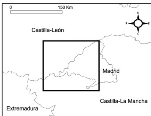
Figura 1. Zona de estudio

Se seleccionó una zona de estudio en el centro de España (Figura 1) cubierta por dos imágenes de satélite coetáneas captadas por los sensores IRS-WiFS (188 m de resolución espacial) y Landsat-TM (30 m) el 29 de septiembre a las 11:33 y 10:32 respectivamente. Los dos sensores presentan bandas en las longitudes de onda correspondientes al rojo (R) y al infrarrojo cercano (IRC): 620-680 nm (R) y 770-860 nm (IRC) para el sensor WiFS y 630-690 nm (R) y 760-900 nm (IRC) para el sensor TM. Las dos imágenes fueron corregidas geoméricamente al Mapa Forestal de España (escala 1:50.000) con un error cuadrático medio ligeramente inferior a un píxel. Los bosques presentes en la zona de estudio se clasificaron mediante el método de máxima verosimilitud usando las bandas R y