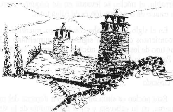
Fig. 140. Belarra.

ro y una adovelada de medio punto en casa Fabián (fig. 26), todas ellas del s. XIX. Existe también un buen número de ventanas, muy bien labradas, de los siglos XVIII y XIX, en casa Buesa , casa Fabián y casa Simón , muchas de ellas enmarcadas con mortero de cal. Bajo los aleraos de los tejados, aparece en algunos edificios decoración resaltada con cal. Todavía se mantienen en pie cuatro chimeneas troncocónicas; una chimenea prismática de gran esbeltez (fig. 80) ha sido derribada en casa Artero poco antes de redactar estas líneas. Palomares en las falsas , portaladas de gran interés, hornos, tizoneras , alguna esquina mata-da , etc. completan una muestra de elementos arquitectónicos de gran interés.