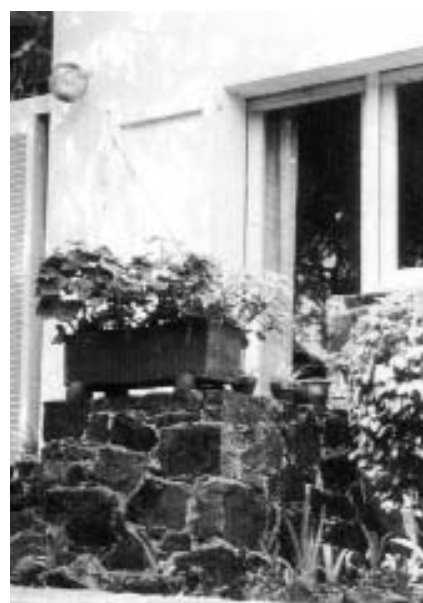
Finestra de la cambra que ocupà Mercè Rodoreda, on acabà Mirall trencat .