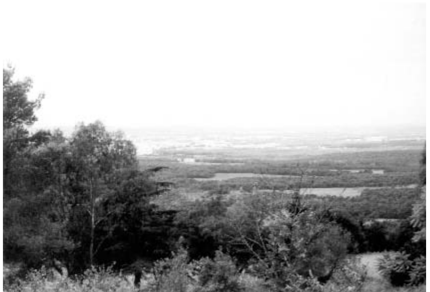
Paisatge que es podia contemplar des de la casa de Mercè Rodoreda a Romanyà de la Selva.

No us agradaria veure “les postes de sol i els naixements de lluna més bonics del món”? Doncs deixeu-vos endur per aquestes paraules de Mercè Rodoreda i visiteu amb els seus llibres Romanyà de la Selva.