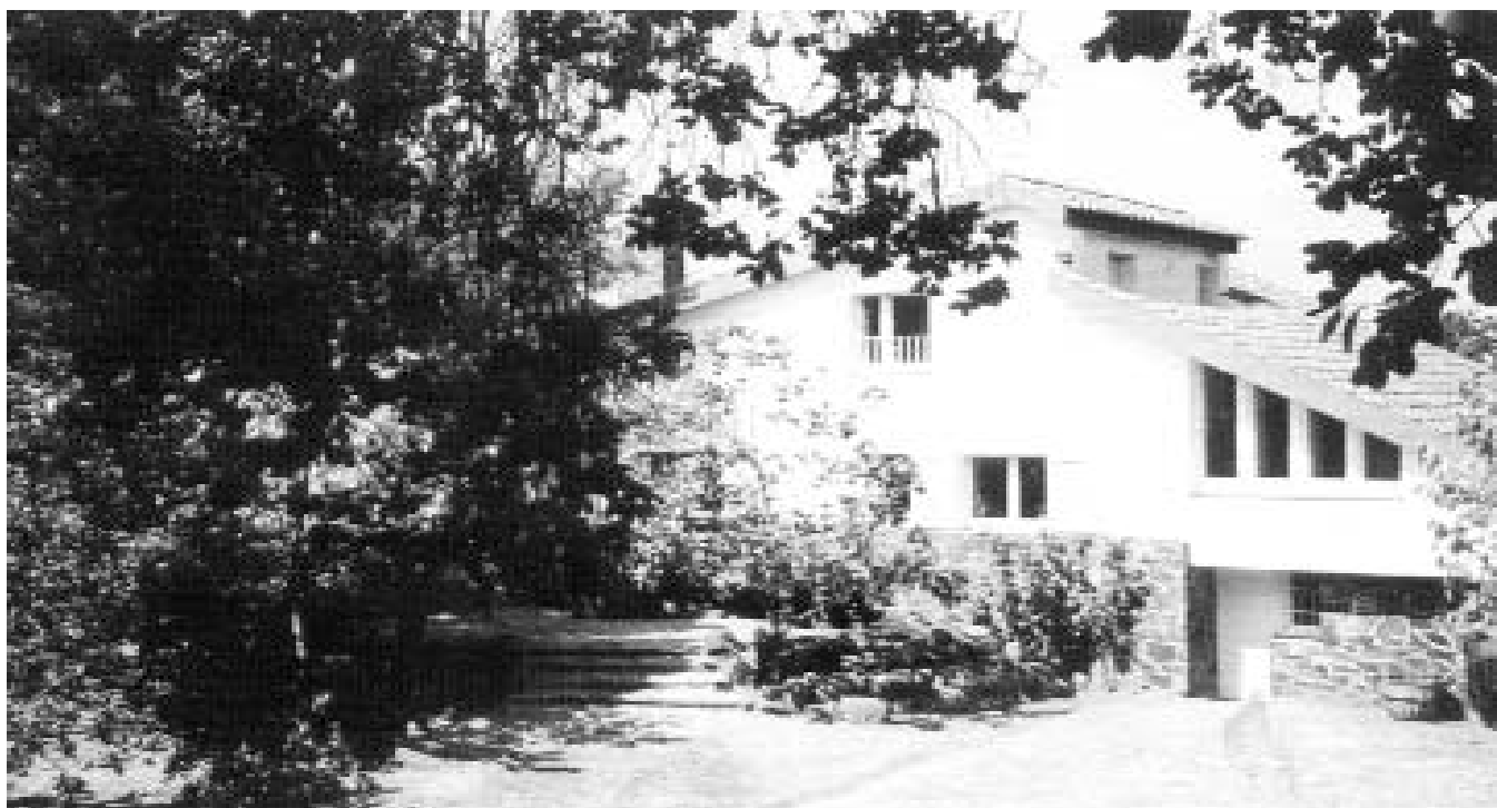
Façana posterior del xalet de Romanyà de la Selva.