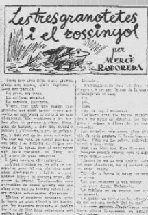
Conte infantil publicat a La Publicitat .