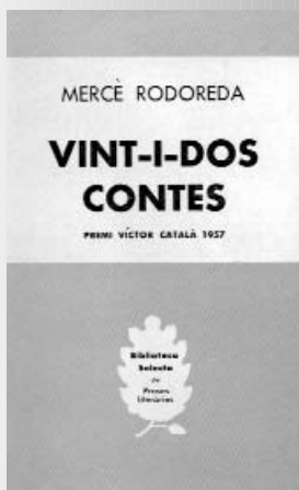
Vint-i-dos contes, 1958