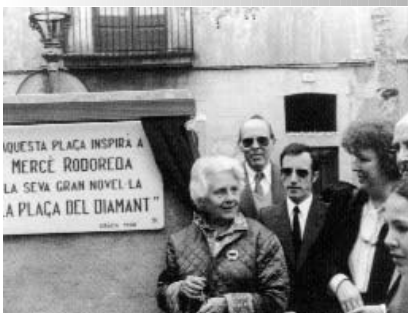
Inauguració de la plaça del Diamant, 1980.