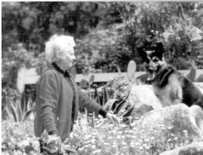
Jardí de la torre de Romanyà de la Selva.

La meva Cristina i altres contes , 1967.