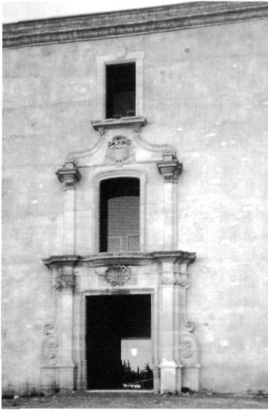
Façana del Palau de l'Abat.

Darrerament hi hem afegit tres noves sèries no cronològiques: