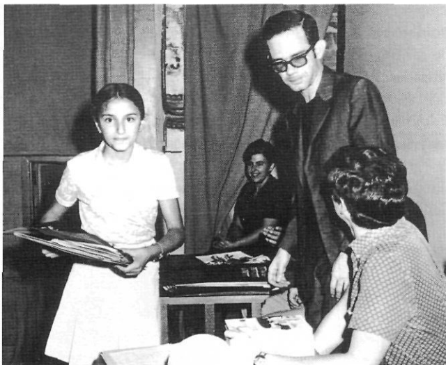
Curset infantil de català (1975).

mentre es converteix en un revulsiu cultural, un cop se n'ha tret la pàtina del temps. Aleshores aquest llegat recobra l'estat primigeni, tan evocador i amb una capacitat de suggestió sotragadora. Per mostra només cal veure l'excel·lent resultat de la restauració del teginat medieval de l'església de Sant Miquel o el retaule gòtic de Sant Bernat i Sant Bernabé, sense obviar les intervencions exteriors a la façana, pinacles, campanar i coberta de l'església de Santa Maria la Major, més que mai una autèntica perla, des-