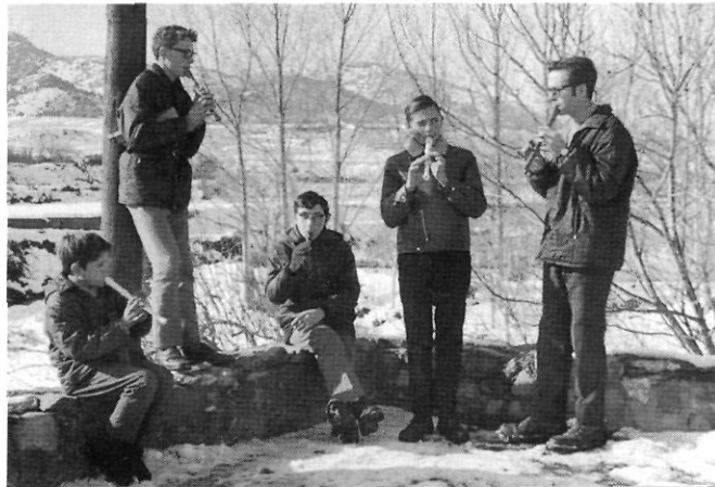
Tocant la flauta un dia de neu sobre el Pont Vell amb els escoltes de Montblanc (anys setanta).

En els darrers anys, la seva tasca pastoral ha anat de bracet amb l'impuls de la restauració i la recuperació d'un patrimoni cultural i religiós de gran importància per als montblanquins, i de molta singularitat en el nostre àmbit cultural. Un llegat que transcendeix la fe i assoleix la mística del plaer estètic,