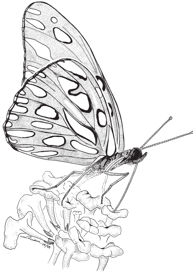
Prancha 3. Agraulis vanillae (Nymphalidae) coletando néctar em Lantana camara .