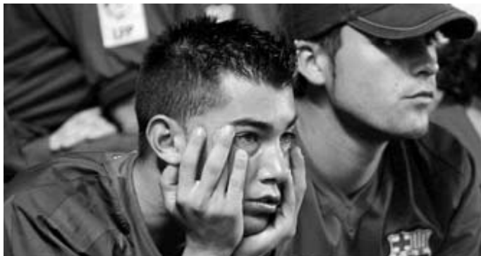
L'aficionat del Barça ha acabat la paciència?

Han passat quatre mesos des que em vaig comprometre a seguir creient en el sentit comú i en mi mateix unes quantes setmanes més. Era, potser, una manera de rebel·lar-me davant d'una realitat que, encara ara, em continua semblant incomprendible. Però no puc pas negar l'evidència: les coses són com són encara que no puguem entendre el perquè. El Toni hi ha volgut trobar explicacions gairebé metafísiques, relacionant el desgavell dels nostres nois amb l'ànsia de desastre i de fracàs que forma part de la pell d'aquest país des d'un 11 de setembre més aviat llunyà. Què voleu que us digui! Potser sí. Bé ens hem d'inventar alguna raó per justificar-nos una mica tot això si no ens volem tornar bojos.