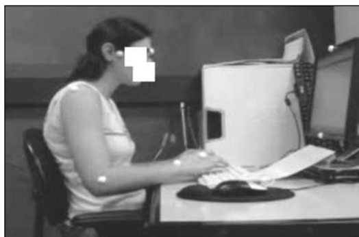
Figura 2 - Posto de trabalho e marcação dos pontos anatômicos de referência

Foram analisados 640 quadros nos 21s de digitação, os quais foram classificados segundo os critérios de avaliação da postura da mão e do punho de Moore e Garg 10 , apresentados na Tabela 1.