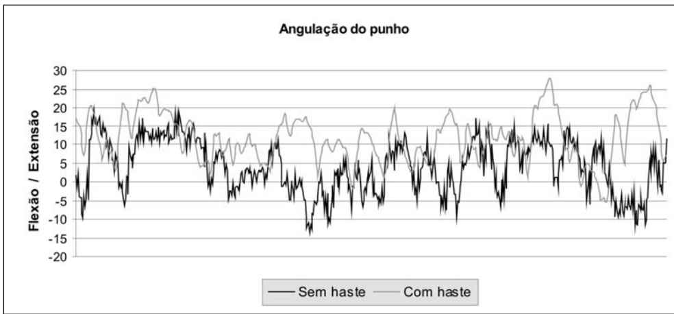
Figura 3 - Gráfico das variações angulares da articulação do punho durante a digitação com e sem hastes do teclado (onde os valores positivos são extensão e negativos são flexão)

Gilad & Harel 9 , através da eletromiografia, verificaram o esforço nos músculos flexor ulnar do carpo e extensor ulnar do carpo em 4 tipos de teclados (2 tradicionais, sendo um com inclinação negativa e outro positiva, e 2 ergonômicos, um com inclinação negativa e outro positiva). Verificaram que a ativação eletromiográfica do extensor ulnar do carpo foi menor nos teclados com inclinação negativa e a ativação do flexor ulnar do carpo foi maior nos teclados ergonômicos do que nos tradicionais. Isso mostra que a utilização das hastes, ou seja, a inclinação positiva dos teclados pode aumentar a ativação muscular dos extensores do punho.