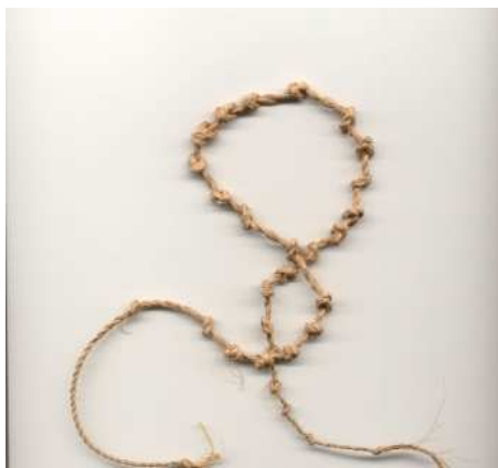
Figura 3- Wekui procedente de la comunidad de Wonken. Foto D Sánchez P - 1989

Además de los wekui que hemos mostrado, tenemos referencias de que tanto los Pemon como los Wo'tuja, utilizaban también, palos con muescas para contar, (llamados Vekui en Pemon) pero lamentablemente no hemos podido hallar ningún ejemplar. En el caso de los Wo'tuja el instrumento descrito se llama dau isodana pajatu roropu . Sin embargo, es posible que algunas otras etnias posean o hayan tenido instrumentos con la misma función, pero tampoco hemos podido hallar, hasta ahora, ninguna referencia sobre ellos.