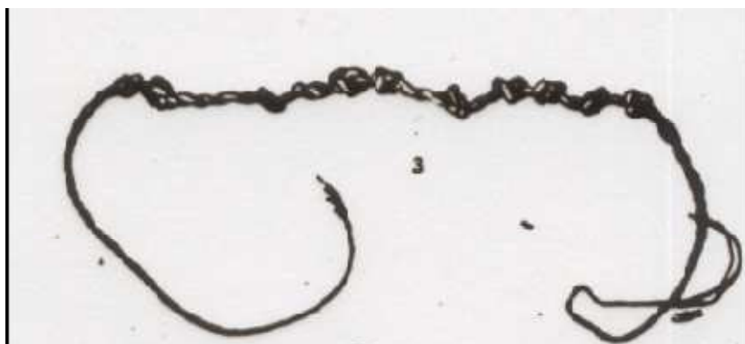
Figura 2 -Dibujo de un Wekui (contador a base de nudos) hallado por Theodor Koch-Grümberg en el sur de Venezuela, con motivo de su expedición etnográfica en 1911.

Uno de los problemas que se nos presentaba, era determinar si alguna etnia utilizaba algún instrumento para contar el tiempo, o cualquier cosa. Ello nos llevó a indagar en la obra extensa de Theodor Koch-Grümberg quien había estado en Venezuela entre 1911-1913 y como buen etnógrafo no solamente fotografió parte de los acontecimientos de su viaje, sino que dibujó variados objetos de uso entre los indígenas de la región sur de Venezuela. Hallamos efectivamente un dibujo de un wekui y su descripción. En efecto, en un trabajo de Fray Cesáreo de Armellada (1991), hallamos una referencia en el diccionario Pemón en la palabra Wekui . Se trataba de un instrumento hecho con hojas de palma tejidas y con nudos. Este instrumento es usado principalmente cuando alguien de la etnia viaja por cierto tiempo, y entonces hacen la cuenta con nudos, y luego, desatando un nudo por día, de los transcurridos, saben los faltantes para llegar al destino, o bien para el regreso a casa.