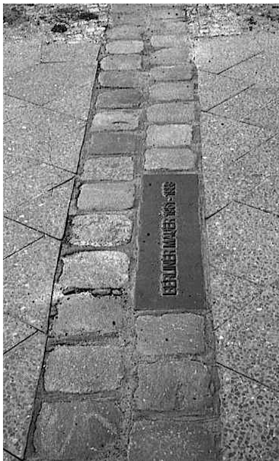
La patrimonialización de la ausencia. Línea de adoquines marcando parte del recorrido del Muro

La memoria no pervive con facilidad, ¿qué se recuerda del Muro, qué queda del Muro? y quizá la pregunta más importante ¿qué se olvida? Estos tres ejes constituyen la memoria de la frontera fallida.