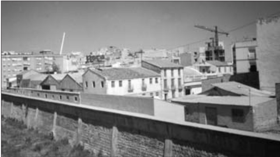
FIGURA 3. Imagen de la calle San Fernando donde se aprecia la degradación que producen las activas y clausuradas instalaciones industriales.

En el vecino barrio de San Diego, hoy en plena fase de expansión urbana y en el que se han construido más de mil viviendas en los últimos años, la presencia industrial es ya inexistente pese al gran peso que tuvo en tiempos pasados. Las pocas almazaras, fábricas de curtidos, de harinas, confección y otras alimenticias que quedaban hasta hace un par de decenios en la avenida de las Fuerzas Armadas, Puente Gimeno o Caballón han desaparecido y han sido sustituidas por modernos bloques de viviendas.