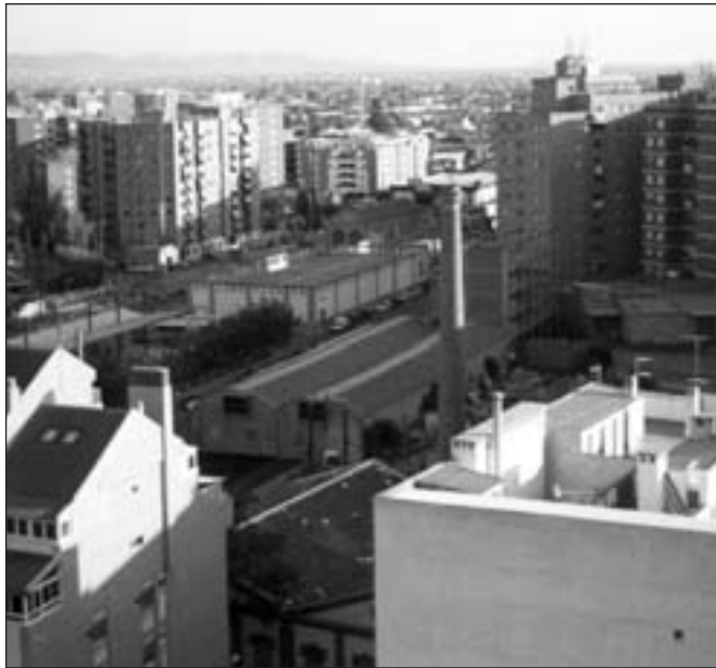
FIGURA 4. Instalaciones de la 'Fundación Poncemar', en la Alameda de Menchirón, ejemplo de antiguo centro industrial y reconvertido hoy en centro administrativo y terciario.

e instalaciones de la «Casa de los Oficios» de formación profesional y las Oficinas Municipales de Empleo; conservándose en el centro la chimenea de ladrillo, que coronaba este complejo industrial, reconvertido en centro administrativo, con lo cual se ha recuperado un espacio inutilizado durante años, para servicio del ciudadano (figura 4):