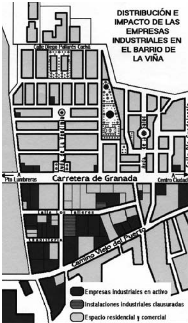
FIGURA 5. Localización e impacto de la actividad industrial en el barrio de La Viña.