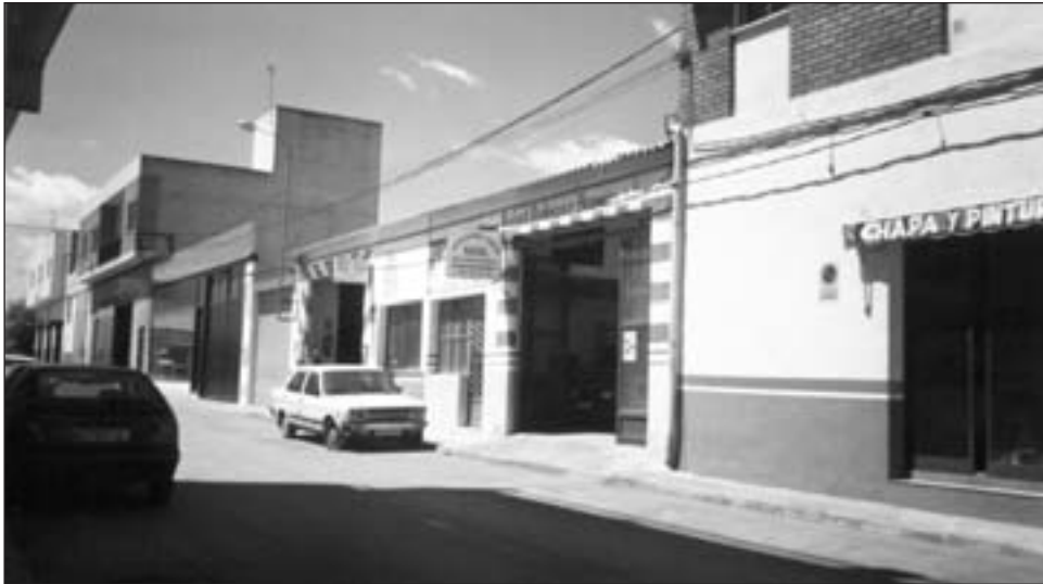
FIGURA 6. La condición de La Viña como barrio periférico ha desencadenado el asentamiento de pequeñas empresas industriales que satisfacen las necesidades del habitante urbano.

La renovación urbana que se ha producido en este popular barrio lorquino en los últimos años y un ejemplo es la Carretera de Granada que ha pasado de ser un corredor industrial hasta los años 80, a una vía bien urbanizada donde las naves industriales han desaparecido y han sido sustituidas por modernas edificaciones para viviendas, aún cuando subsisten algunas instalaciones que han sido reutilizadas para acoger grandes establecimientos comerciales especializados, modelo muy implantado en el contiguo polígono de Los Peñones.