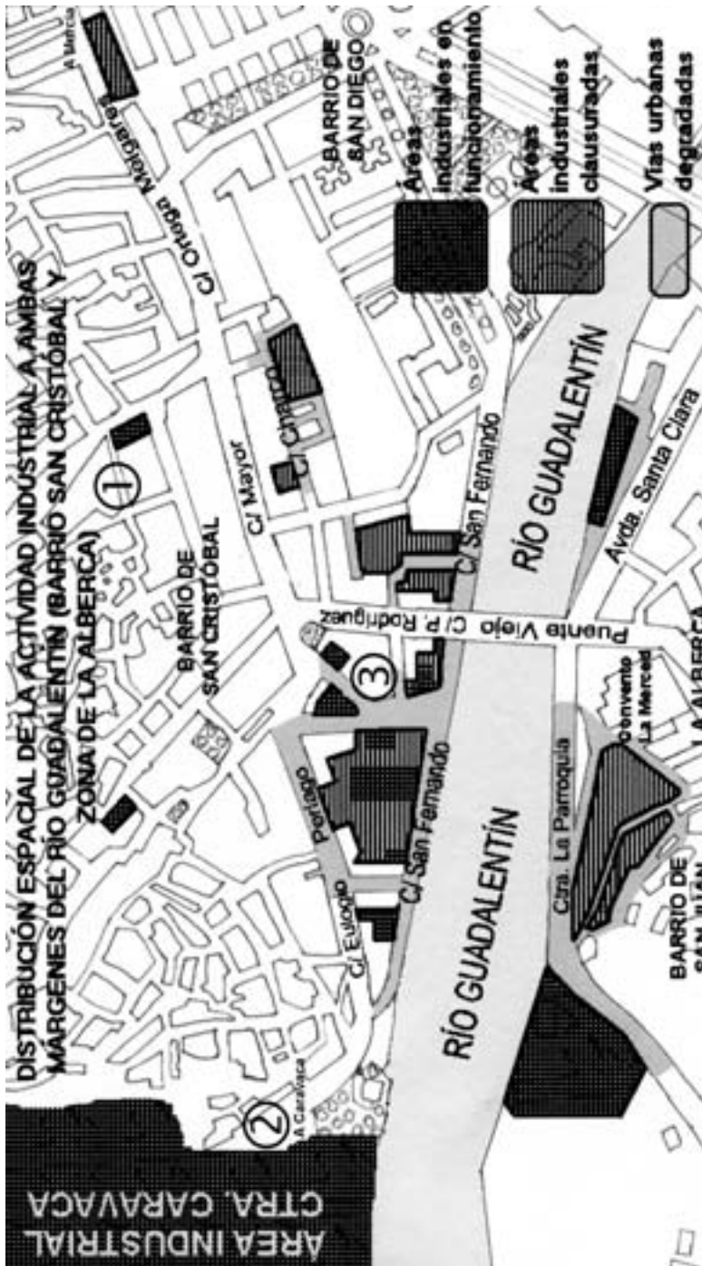
FIGURA 2. Distribución e impacto de la actividad industrial en el barrio de San Cristóbal y en la zona de La Alberca.