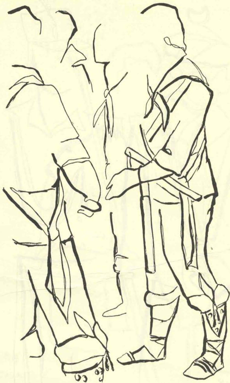
Danzantes en pie. Octubre-noviembre, 1979. J. Alvar.