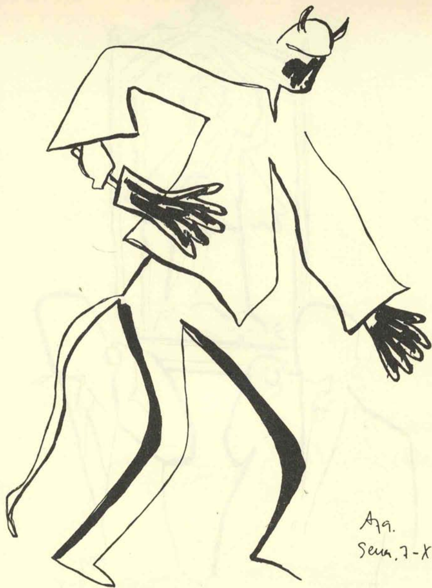
Diablo. Octubre-noviembre, 1979. J. Alvar.