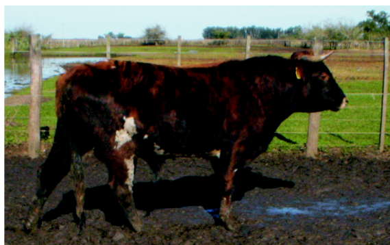
Figura 4. Toro Patagónica (PM)

Las variables zoométricas medidas en centímetros fueron: