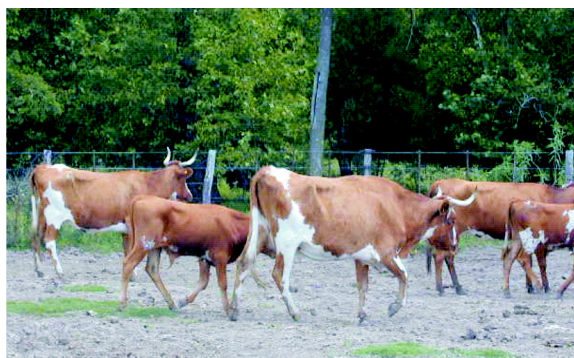
Figura 3. Vaca Patagónica (PH)