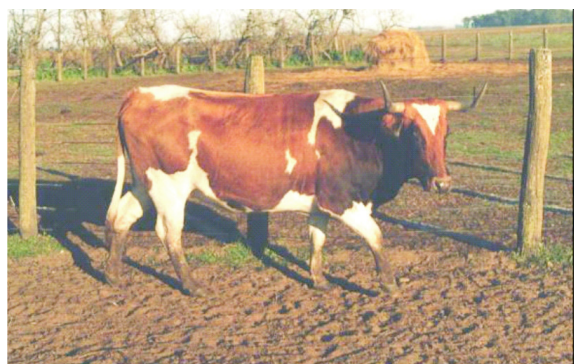
Figura 1. Vaca NOA (NH)

mayores de tres años de edad, 146 pertenecientes a la PAT y 113 al NOA. Los animales de cada región fueron discriminados según sexo (M= macho y H= hembra), determinándose cuatro poblaciones según origen y sexo: hembras NOA (NH =80) (Figura 1), machos NOA (NM=33) (Figura 2), hembras patagónicas (PH=115) (Figura 3) y machos patagónicos (PM=31) (Figura 4).