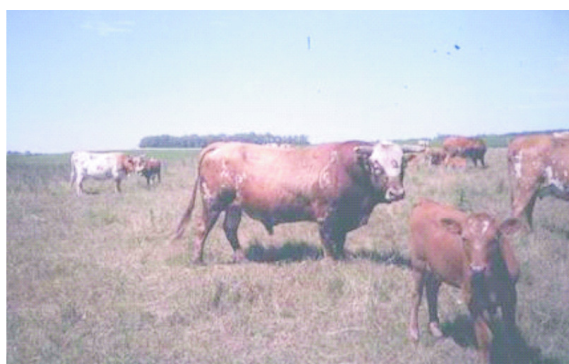
Figura 2. Toro NOA (NM)