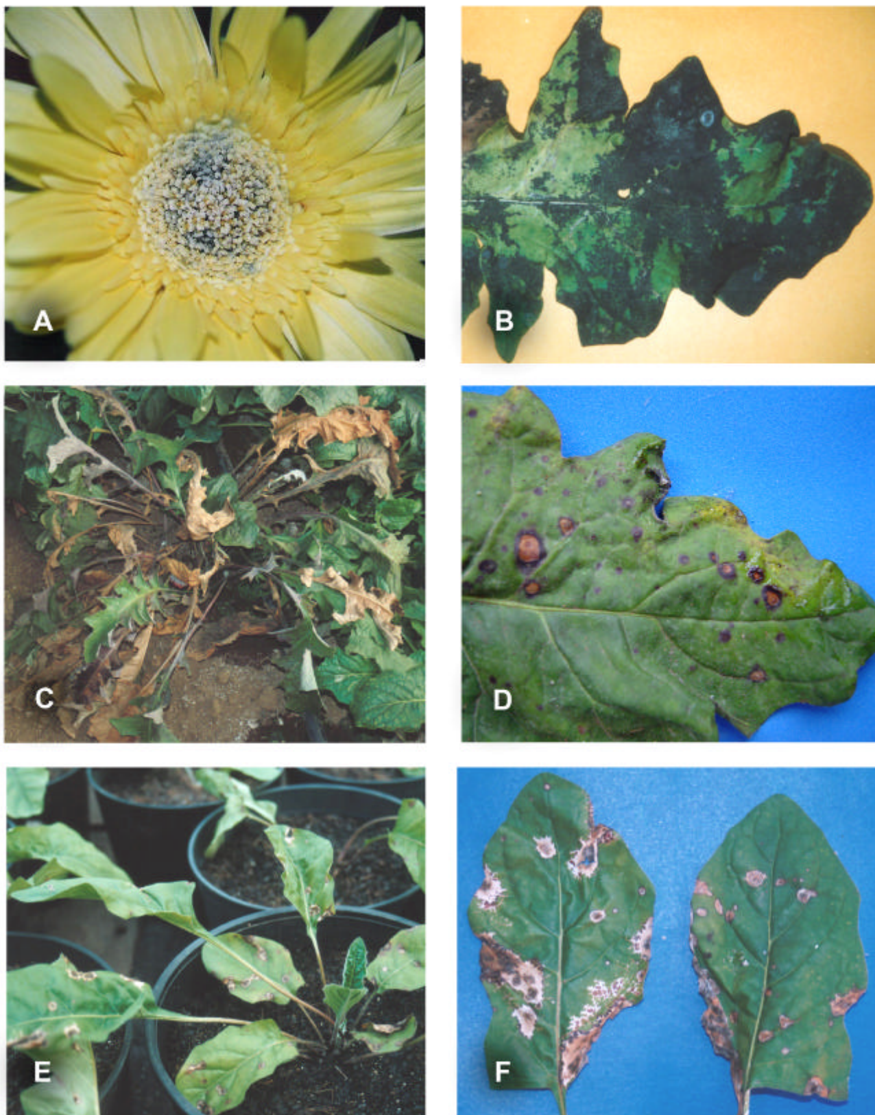
FIGURA 2 – Sintomas de doenças fúngicas e bacterianas em Gerbera jamesonii : A) Mofo cinzento ( Botrytis cinerea ) em flor (B) Folha com fumagina ( Capnodium sp.) (C) Planta afetada por Pythium sp. (D) Cercosporiose ( Cercospora cryptogea ): detalhe das lesões na folha (E) Planta afetada pela mancha bacteriana ( Pseudomonas cichorii ) e detalhe das lesões na folha (F).