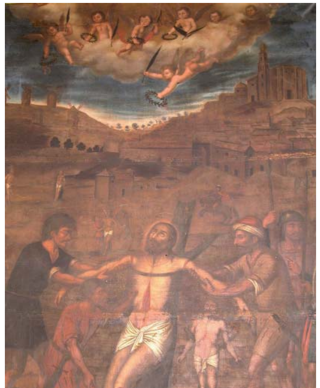
MARTIRIO DE LOS PATRONES DE OSUNA: SANTOS ARCADIO, LEÓN, NICÉFORO, ABUNDANCIO Y SUS NUEVE COMPAÑEROS.

Sin embargo, hasta hace aproximadamente unos tres años no me había fijado atentamente en el gran cuadro, «por sus proporciones 3 por 2 metros aproximadamente», que hay colgado en el crucero derecho y que representa el martirio de San Arcadio y sus cuatro compañeros. En la tela, muy vencida por el paso del tiempo, no se pueden leer las letras de la parte baja, aunque parece ser que son los nombres de todos los mártires representados. El marco es bastante interesante, no así la pintura, en la que coinciden casi todos los que la han descrito: «obra mediocre en lo artístico».