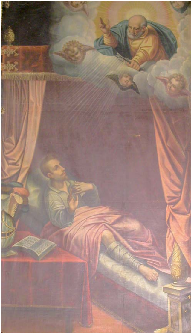
REVELACIÓN A SAN IGNACIO DE LOYOLA ESTANDO HERIDO EN PAMPLONA