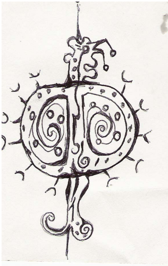
Ilustración 4 Molusco

Sfez Lucien (1984), Crítica de la decisión , México, FCE.