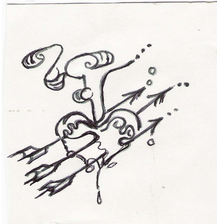
Ilustración 3 Sacrificio

En estos términos la decisión posee multifinalidad en vez de libertad, multirracionalidad en vez de racionalidad y multilinealidad en vez de linealidad.