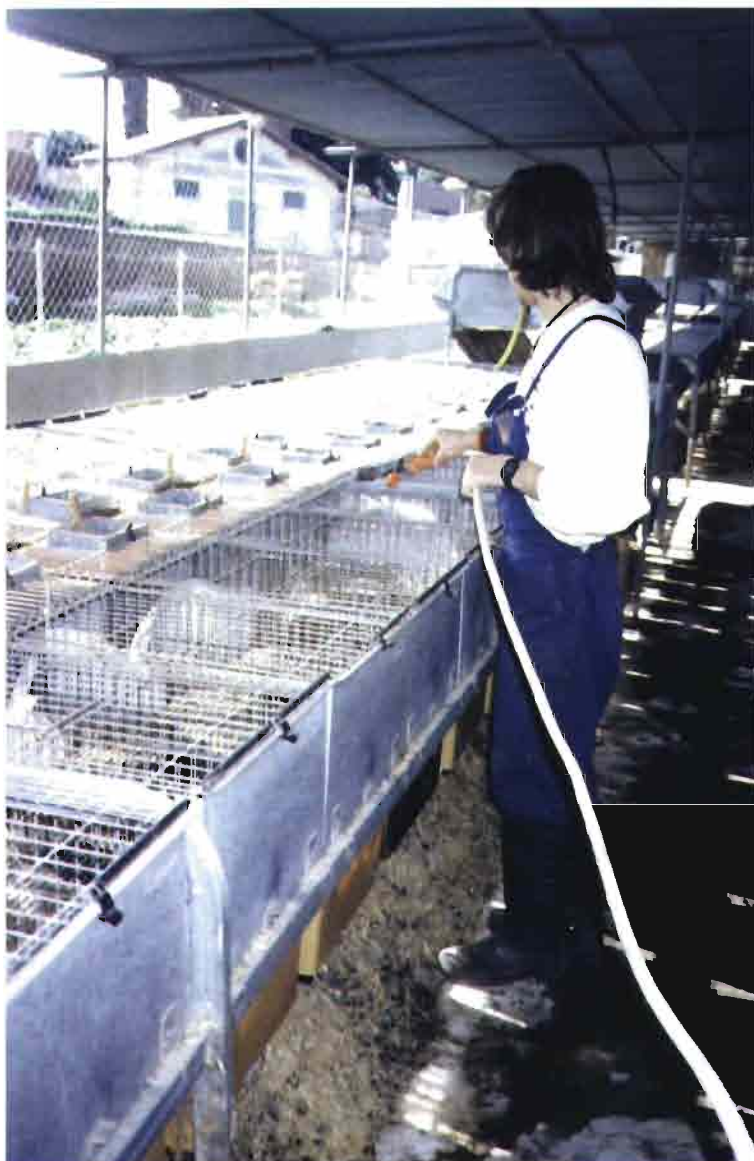
■ Quemado de pelo con un soplete y llama de gas. Es indispensable en las granjas cunícolas.

El éxito de una buena desinsectación estriba en la constancia de la aplicación y a la acción prolongada de los productos.