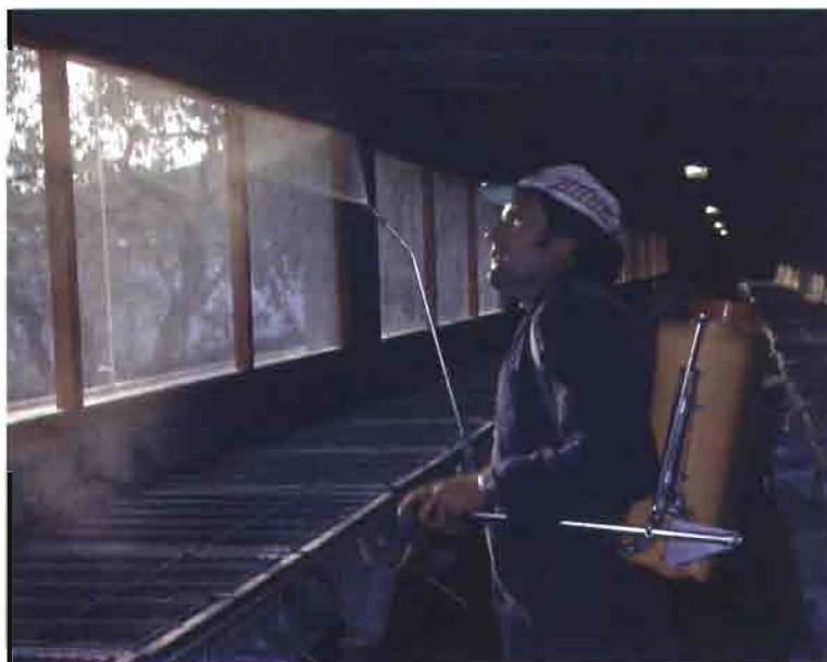
■ Desinsectación de las ventanas y telas mosquiteras.

Los desinsectantes están elaborados por sustancias químicas que suelen aplicarse, diluidas en agua, en pulverización en el alojamiento. Interesa utilizar los productos de forma combinada de manera que unos se apliquen hacia los estados adultos y otros que pretendan romper su ciclo actuando en las formas larvarias.