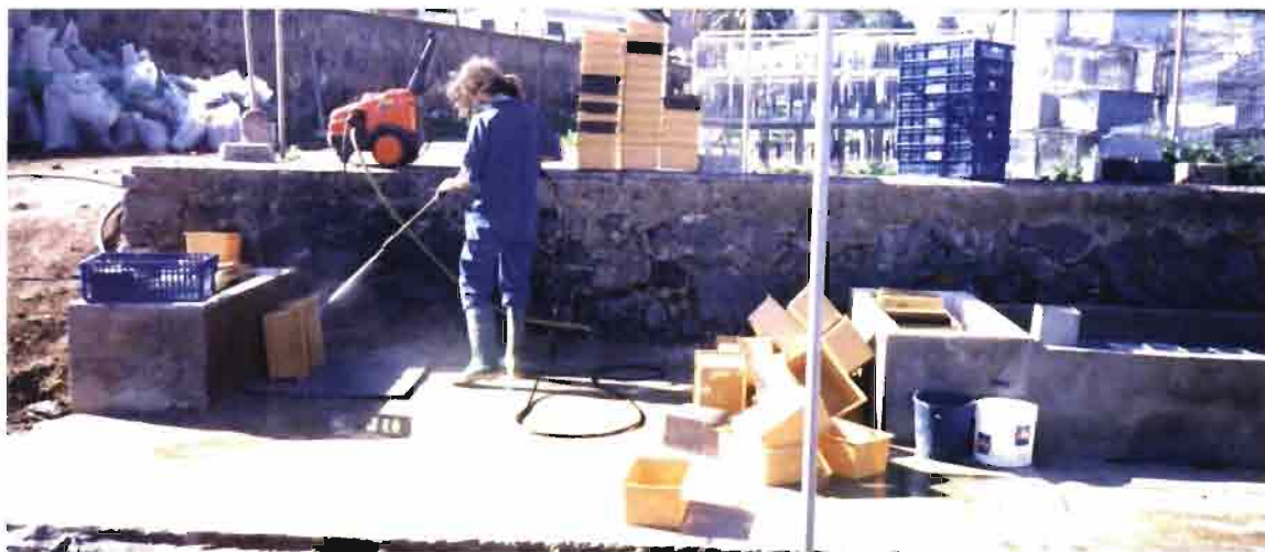
Desinfección de las cubetas de plástico de los nidos en un patio soleado.

vehículo de difusión de los elementos microbianos, lo cual puede incluirse como una modalidad más de contaminación pasiva, por contacto directo o indirecto de elementos estáticos con los animales alojados.