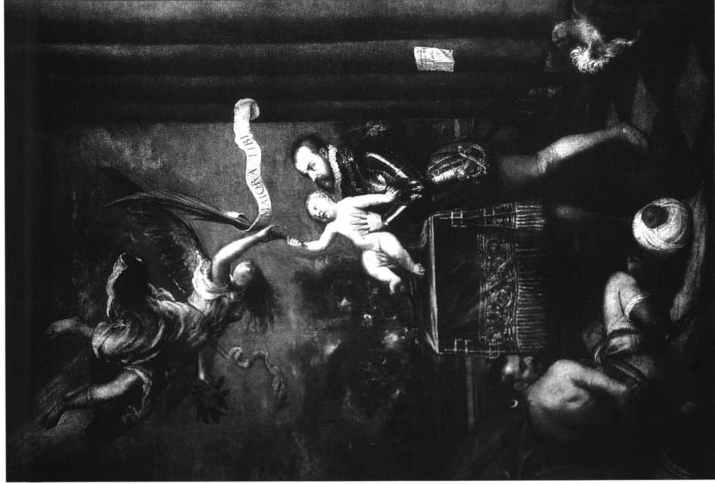
Fig. 3. Tiziano: Retrato alegórico de Felipe II ofreciendo al cielo al infante don Fernando (1573-1575). Óleo sobre lienzo. Museo Nacional del Prado.