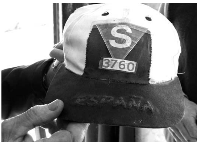
Gorra de Mauthausen.