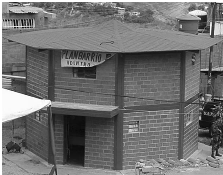
Figura 1. CONSULTORIO POPULAR. REPÚBLICA BOLIVARIANA DE VENEZUELA. AÑO 2003.

El 14 de diciembre de 2003, luego de obtenerse excelentes resultados con el Plan nace la Misión Barrio Adentro, donde el presidente de la República, Hugo Chávez Frías, juramentó una Comisión Presidencial, presidida por el tercer ministro de Salud del gobierno bolivariano Roger Capella (2003-2004). Ese mismo día se inauguraron los primeros veinte Consultorios Populares (Figura 1) o Casas de la Salud y la Vida, como primer paso para alcanzar la meta estimada de 5.000 consultorios para el año 2004.