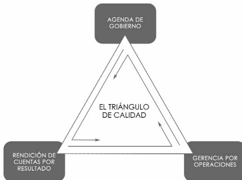
Figura 3. EL TRIÁNGULO DE CALIDAD DE LA GESTIÓN

Por el contrario, genera coherencia de alta calidad cuando hay evaluación sistemática por desempeño y, en ese caso, nivela hacia arriba , hasta igualar la calidad del sistema más potente. El sistema de petición y prestación de cuentas determina y domina el triángulo de hierro. Es el sistema rector del triángulo. Es el punto de referencia para la verificación de la coherencia en relación con cualquier innovación en los sistemas de Alta Dirección.