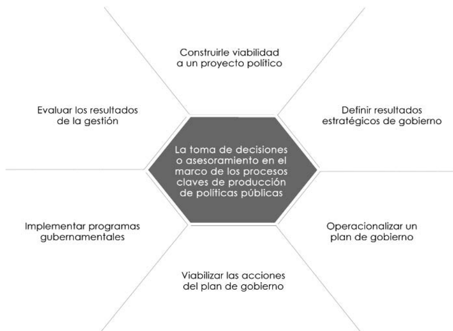
Figura 1. CAPACIDADES CLAVE DEL TÉCNICO-POLÍTICO